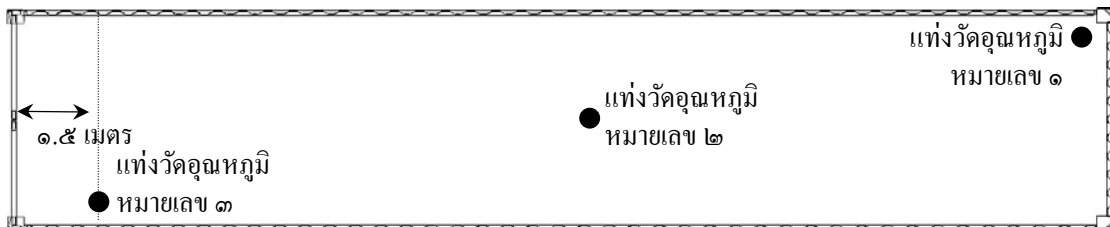
ภาพที่ ๑ ตำแหน่งการวางแท่งวัดอุณหภูมิผลไม้ภายในตู้ขนส่งสินค้าสำหรับการกำจัดศัตรูพืชด้วยความเย็นระหว่างขนส่ง