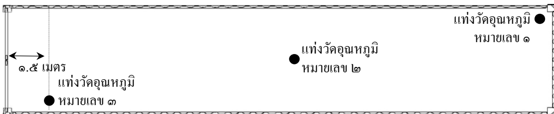
ภาพที่ ๑ ตำแหน่งการวางแท่งวัดอุณหภูมิผลไม้ภายในตู้ขนส่งสินค้าสำหรับการกำจัดศัตรูพืชด้วยความเย็นระหว่างขนส่ง