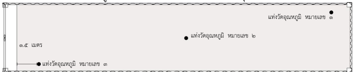
ภาพที่ ๑ ตำแหน่งการวางถังวัดอุณหภูมิผลไม้ภายในตู้ขนส่งสินค้าสำหรับการกำจัดศัตรูพืชด้วยความเย็นระหว่างขนส่ง