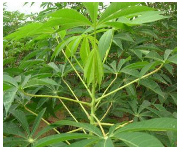
พันธุ์ระยอง 11