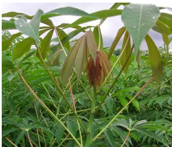
พันธุ์เกษตรศาสตร์ 50