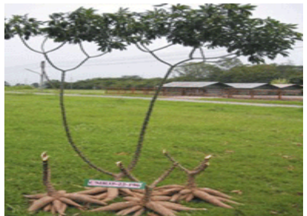
พันธุ์ระยอง 11