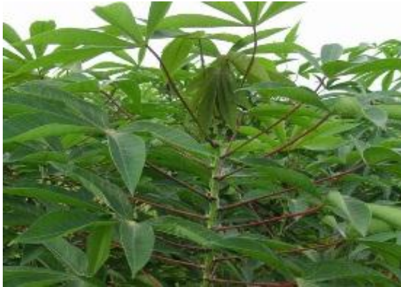
พันธุ์ระยอง 5