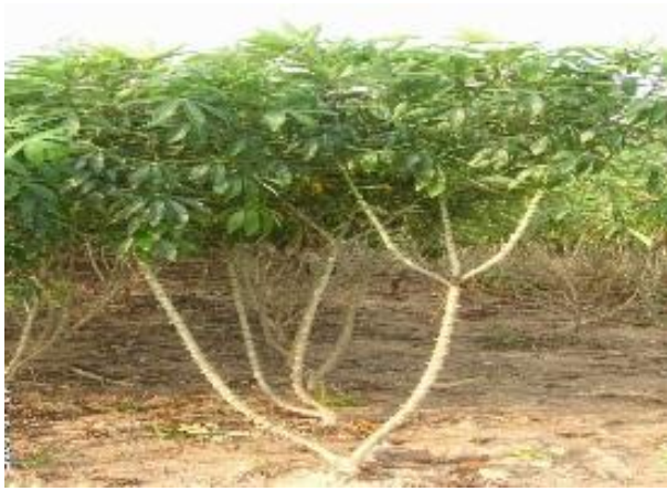
พันธุ์ระยอง 5