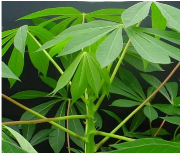
พันธุ์ระยอง 9