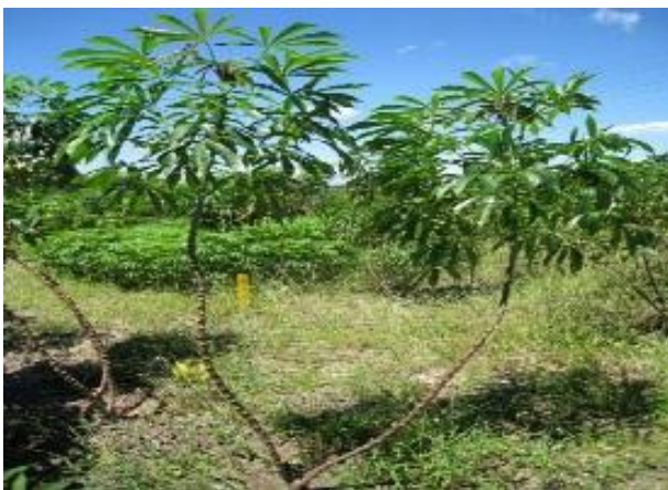
พันธุ์เกษตรศาสตร์ 50