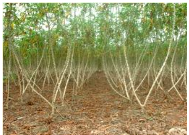
พันธุ์ห้วยบง 60