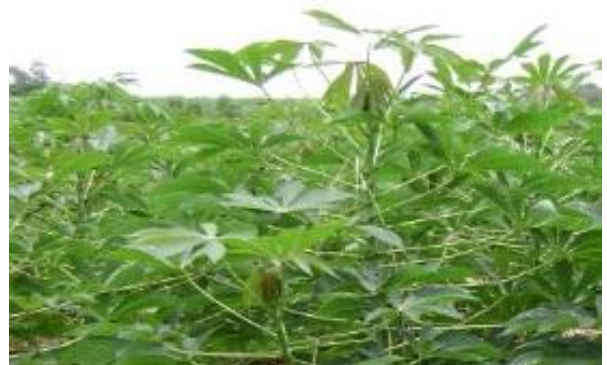
พันธุ์ระยอง 7