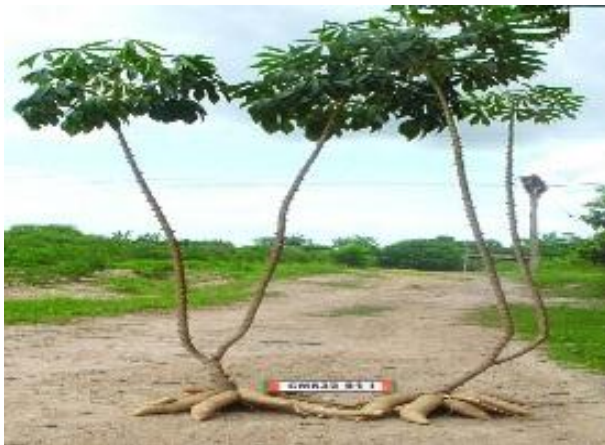
พันธุ์ระยอง 9