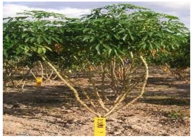
พันธุ์ระยอง 7