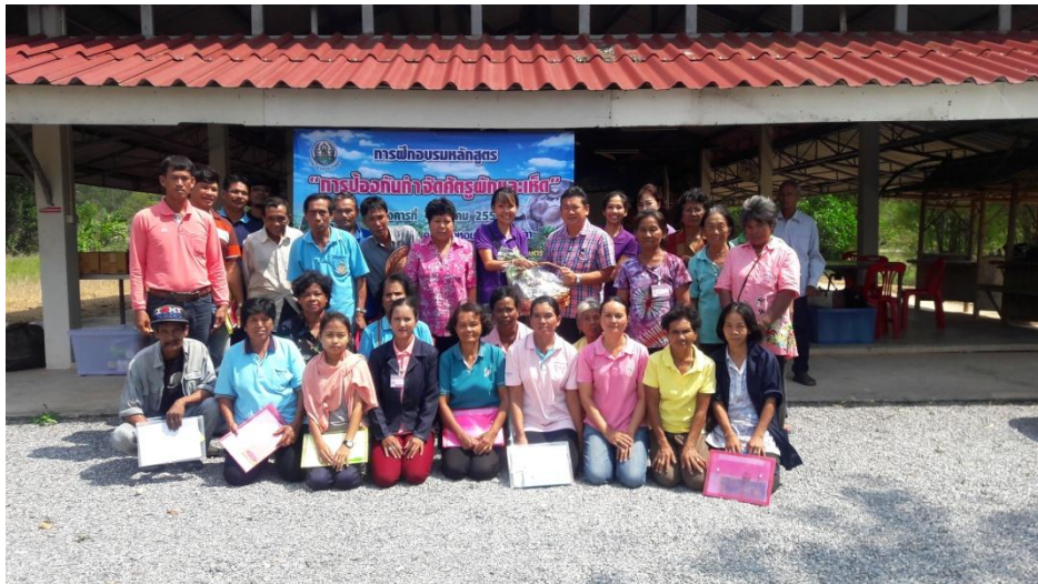
ภาพ กิจกรรม การศึกษา