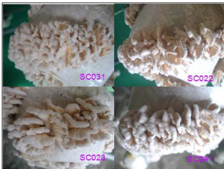
ภาพที่ 3 ลักษณะเห็ดแครงแต่ละสายพันธุ์