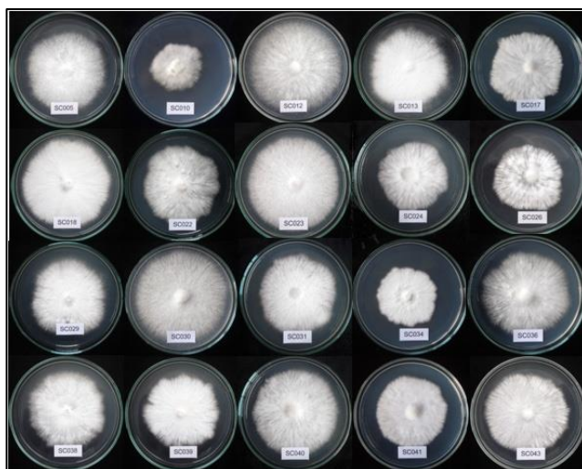
ภาพที่ 1 การเจริญของเส้นใยเห็ดแครง 20 สายพันธุ์ บนอาหารฟีดเอ อายุ 6 วัน