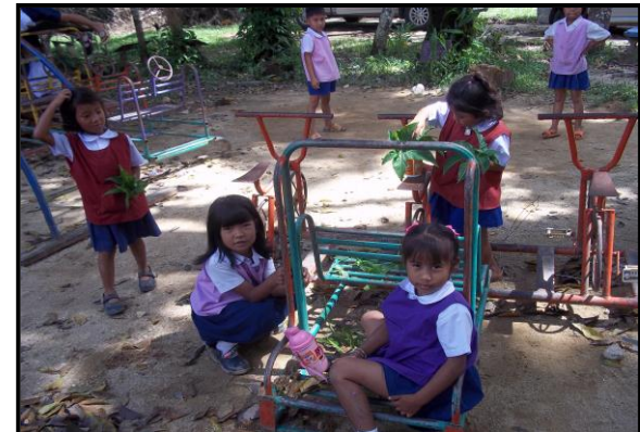
ภาพผนวกที่ ๕ กิจกรรมการดำเนินงาน ณ โรงเรียน ตชด. บ้านไอร์ป้อแต อำเภोजะเณระ จังหวัดนราธิวาส