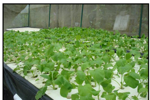
ภาพผนวกที่ ๔ กิจกรรมการดำเนินงาน ณ โรงเรียนจรรยาอิสลามวิทยา อำเภอตากใบ จังหวัดนราธิวาส