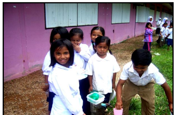
ภาพผนวกที่ ๒ กิจกรรมการดำเนินงาน ณ โรงเรียนบ้านไฮอร์โฮ อำเภोजะเณระ จังหวัดนราธิวาส