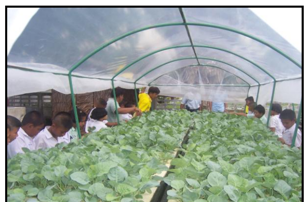
ภาพผนวกที่ ๑ กิจกรรมการดำเนินงาน ณ โรงเรียนวัดพระพุท อําเภอตากใบ จังหวัดนราธิวาส