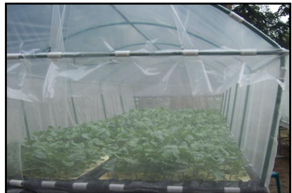
ภาพผนวกที่ ๓ กิจกรรมการดำเนินงาน ณ โรงเรียนพิทักษ์วิทยาคม อำเภोजะเณะ จังหวัดนราธิวาส