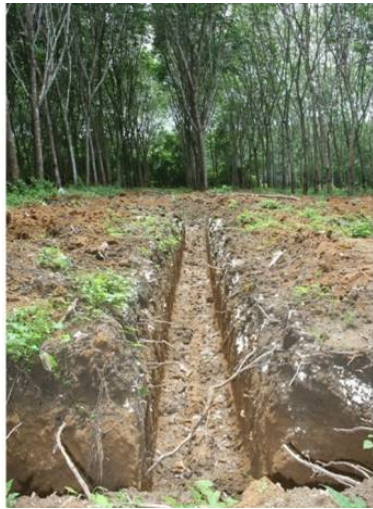
ภาพที่ 3 การขุดร่อง กว้าง 30 เซนติเมตร ลึก 60 เซนติเมตร