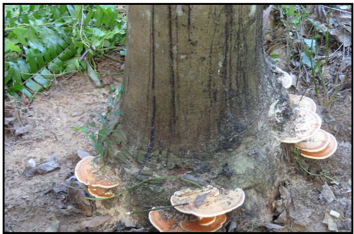
ภาพที่ 4 ลักษณะดอกเห็ดโรครากขาว จากแปลงกรรมวิธีไม่ใช้สารเคมีกำจัดโรครากขาวของยางพารา