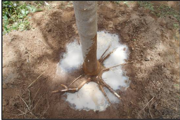
ภาพที่ 2 การแพร่กระจายของเชื้อราในร่องรอบโคนต้น