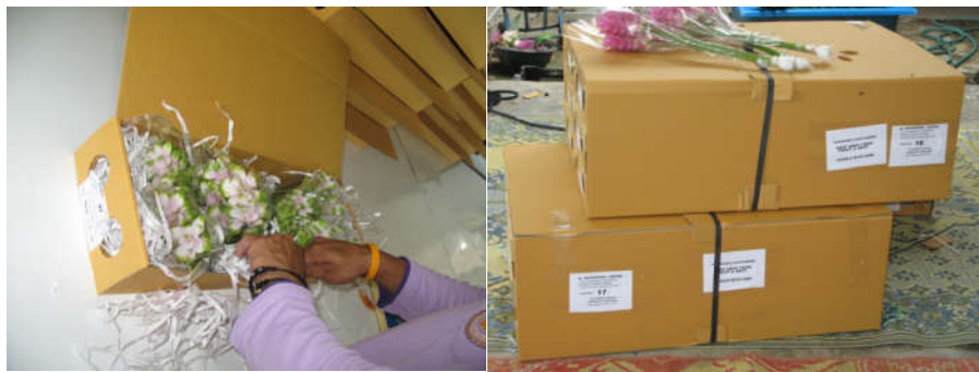
ภาพที่ 4 การทดลองส่งออกในรูปแบบไม้ตัดดอกไปยังตลาดญี่ปุ่น