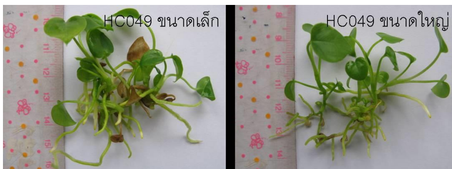
ภาพที่ 4 ต้นกล้าหน้าวัวสายพันธุ์ HC049 จากการเพาะเลี้ยงเนื้อเยื่อในอาหารเหลวด้วยระบบ TIB นาน 12 สัปดาห์ เริ่มต้นเพาะเลี้ยงที่ขนาดต้นต่างกัน