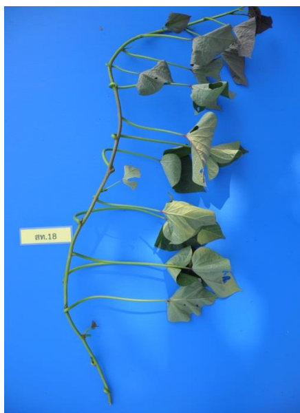
ภาพที่ 1 ลักษณะเถา