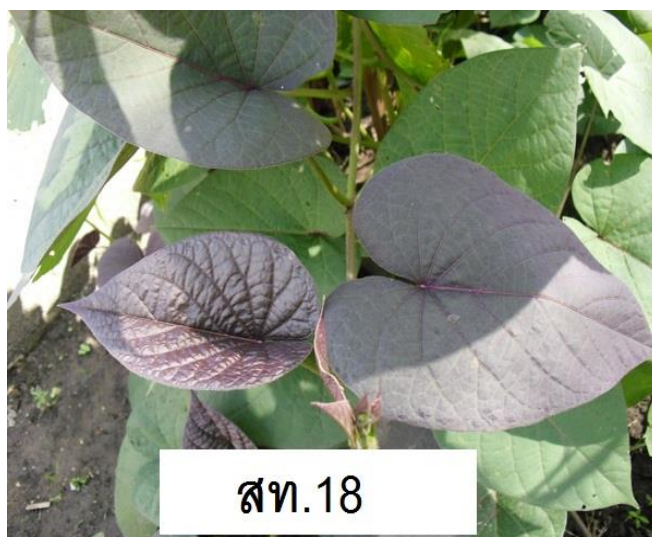
ภาพที่ 2 ลักษณะใบ