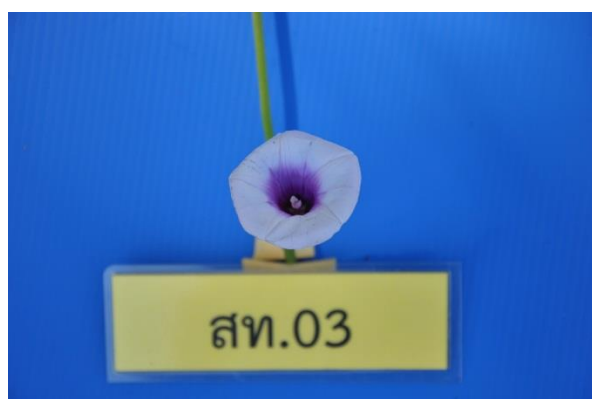
ภาพที่ 6 รูปร่างและสีของดอก