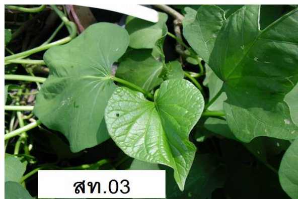
ภาพที่ 2 ลักษณะใบ