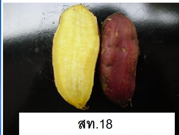
ภาพที่ 10 สีเนื้อเมื่อสุก