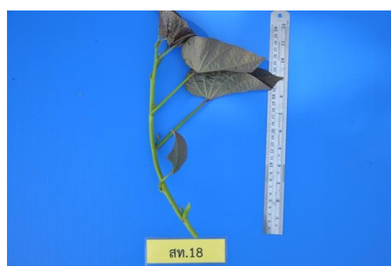
ภาพที่ 4 ลักษณะยอด