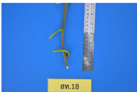
ภาพที่ 3 ก้านและข้อ