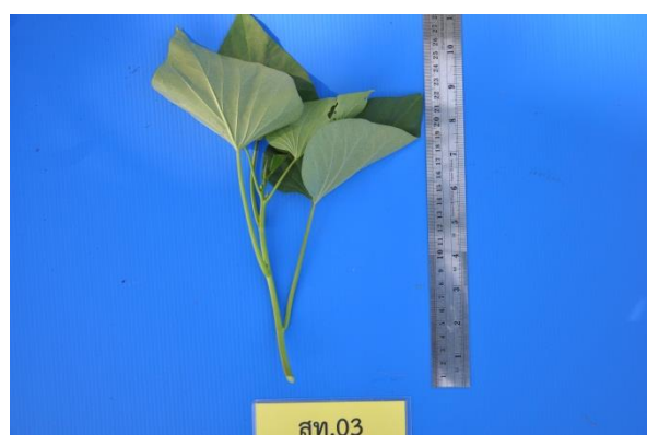
ภาพที่ 4 ลักษณะยอด