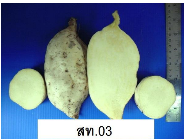
ภาพที่ 9 เนื้อและสีเนื้อ