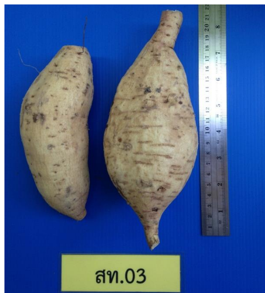
ภาพที่ 8 รูปร่างและสีของหัว