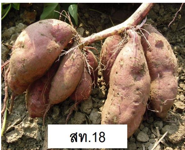
ภาพที่ 7 การลงหัว