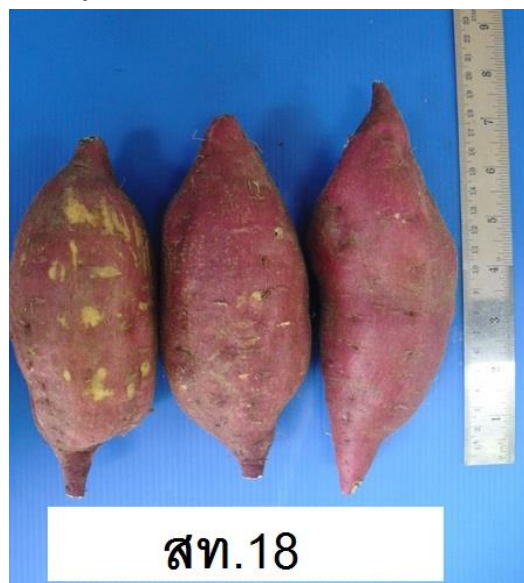
ภาพที่ 8 รูปร่างและสีของหัว