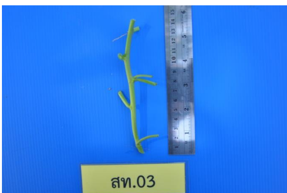
ภาพที่ 3 ก้านและข้อ