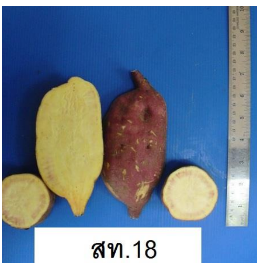
ภาพที่ 9 เนื้อและสีเนื้อ