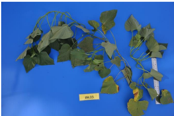
ภาพที่ 1 ลักษณะเถา