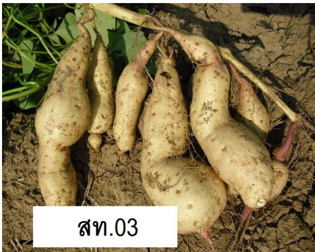
ภาพที่ 7 การลงหัว