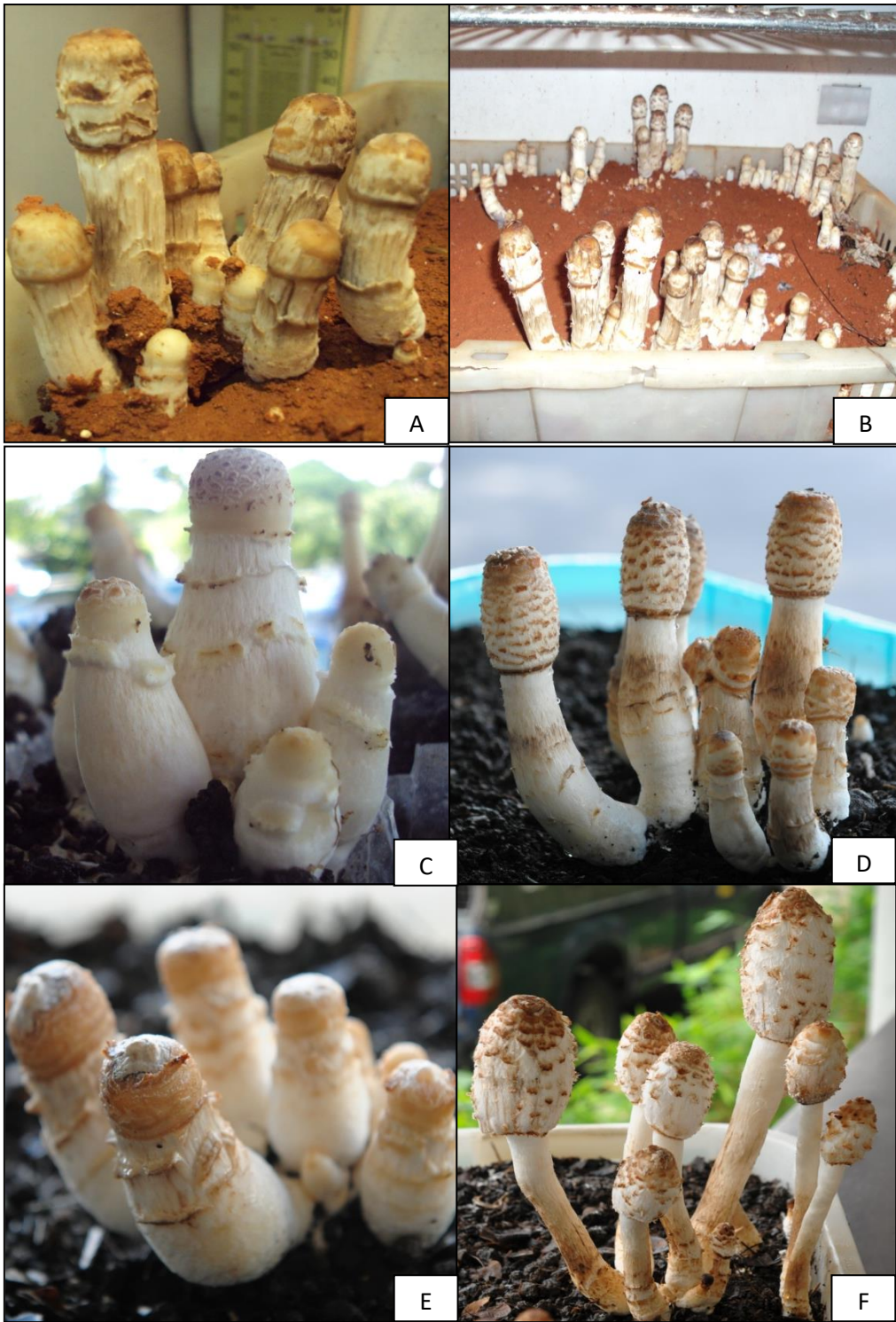
ภาพที่ 2 การเกิดดอกเห็ดถั่วฝรั่งบนวัสดุเพาะในตะกร้าพลาสติกทำการเปิดดอกในตู้ควบคุมอุณหภูมิที่ 18-20°C A,B: Comatus1 อายุ 12 และ 13วัน C,D: Comatus3 อายุ 9 และ 10วัน E,F: Comatus5 อายุ 5 และ 14 วัน