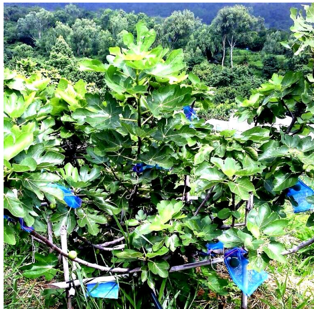
ภาพที่ 2 สภาพต้นที่เจริญเติบโตและติดผลได้ดีในช่วงต้นฤดูฝน (ปลายเดือน พ.ค. 2558)