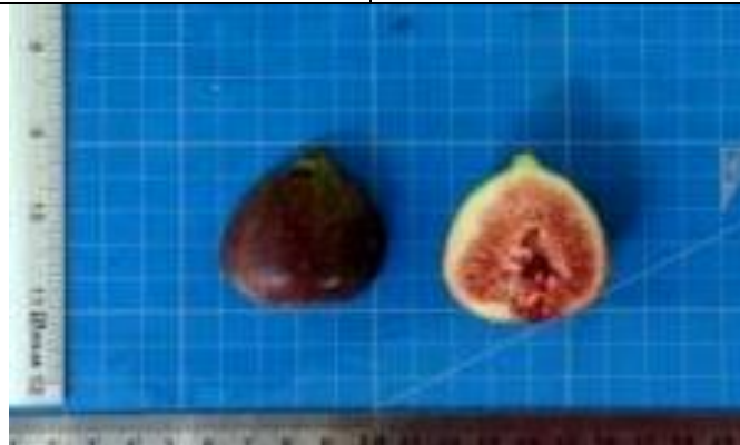
ภาพที่ 7 ผลมะเดื่อฝรั่งพันธุ์ Verte