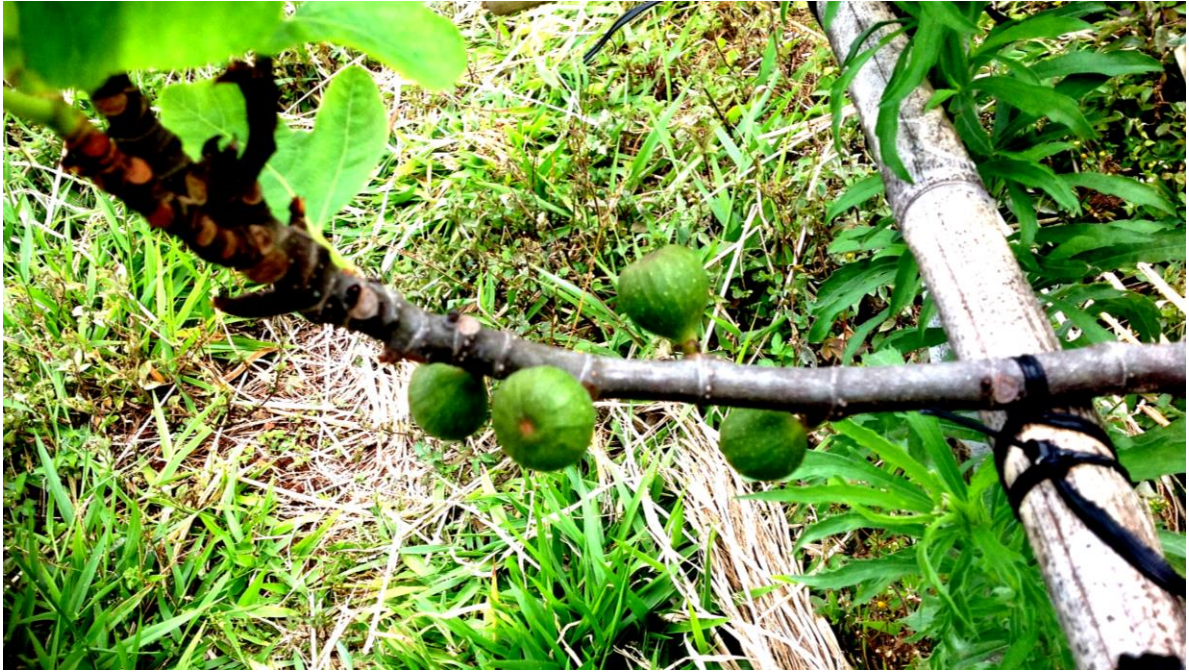
ภาพที่ 1 ผลมะเดื่อฝรั่งที่เริ่มติดผลในช่วงปลายเดือนมิถุนายน 2558