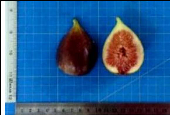
ภาพที่ 3 ผลมะเดื่อฝรั่งพันธุ์ Brown turkey