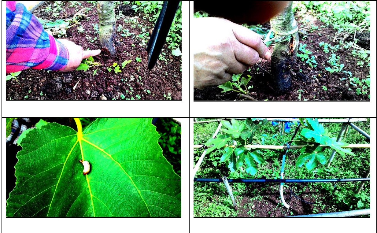
ภาพที่ 8 การป้องกันและกำจัดด้วงเจาะลำต้น ด้วยการกำจัดวัชพืชรอบลำต้น ใช้สารเคมีกำจัดรวมทั้งการทาสีน้ำมันผสมสารป้องกันแมลงรอบโคนและต้น