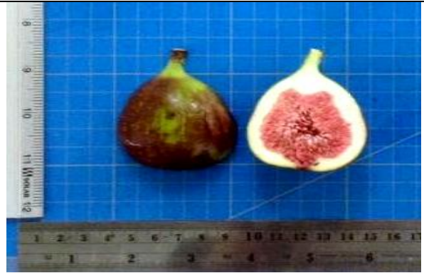
ภาพที่ 4 ผลมะเดื่อฝรั่งพันธุ์ Dauphine