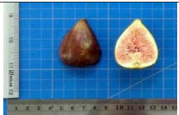
ภาพที่ 6 ผลมะเดื่อฝรั่งพันธุ์ Veriegata