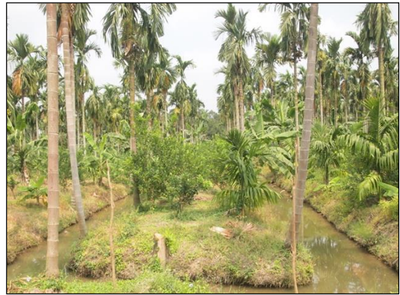
สวนส้มโอปลูกร่วมกับพืชอายุยาว