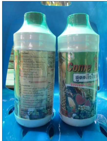
ภาพที่ 3: ปัจจัยการผลิตไม้ผล