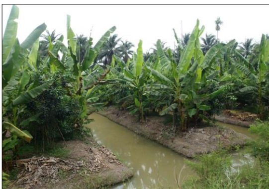
สวนส้มโอปลูกร่วมกับพืชอายุสั้น