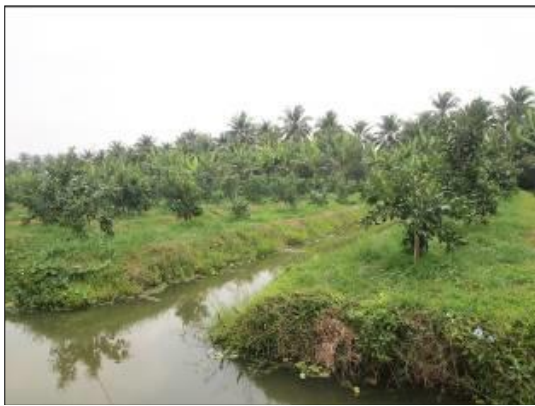
สวนส้มโอปลูกเชิงเดี่ยว