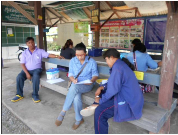
สัมภาษณ์เกษตรกรผู้ปลูกขมพู