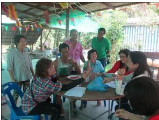
ภาพที่ 1: สำรวจแหล่งผลิตไม้ผลในพื้นที่จังหวัดนครปฐม