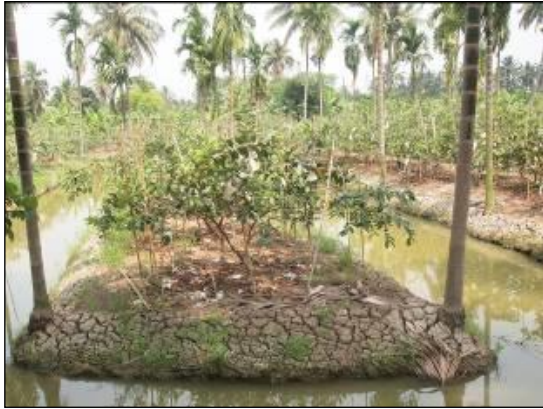
สวนมะนาว