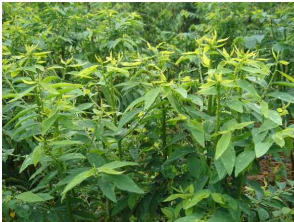
ขนาดยอดฝักหวานบ้านพร้อมเก็บเกี่ยว