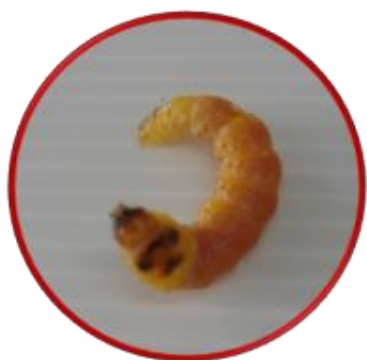
หนอนเจาะลำต้น