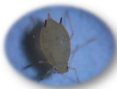
เพลี้ยอ่อน