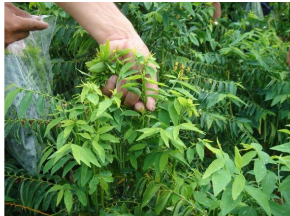
การตัดยอด