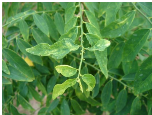
อาการที่พบ