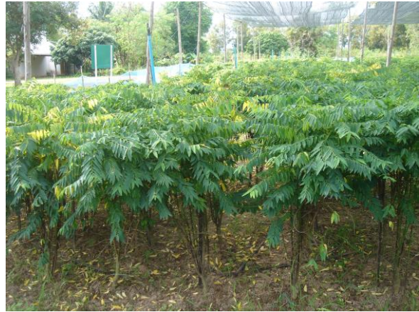
ฝักหวานบ้านอายุ 9 เดือน