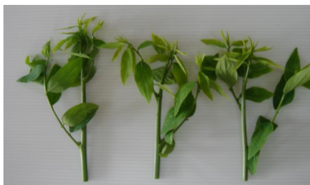
ขนาดยอดที่ทำการเก็บเกี่ยว