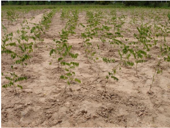
สภาพแปลงหลังย้ายปลูกลง 7 วัน