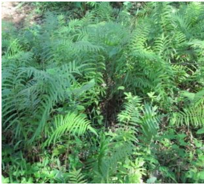
กุตเกียะ

ภาพผนวกที่ 1 พันธุ์พืชในคลองลำซามและคลองลำภู