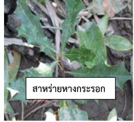
สาหร่ายทางกระรอก