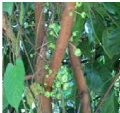
มะเดื่อฉิ่ง