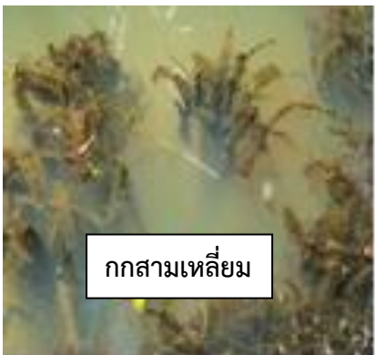
กกสามเหลี่ยม