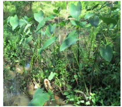
บอนเขียว