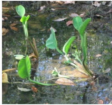
ตาลปัตรฤาษี