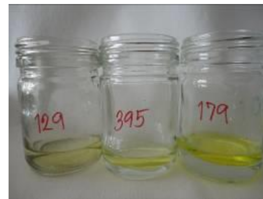
ภาพที่ 1 ตัวอย่างสีของน้ำมันถั่วเขียวที่ทำการวิเคราะห์หาเปอร์เซ็นต์ไขมันในเมล็ด