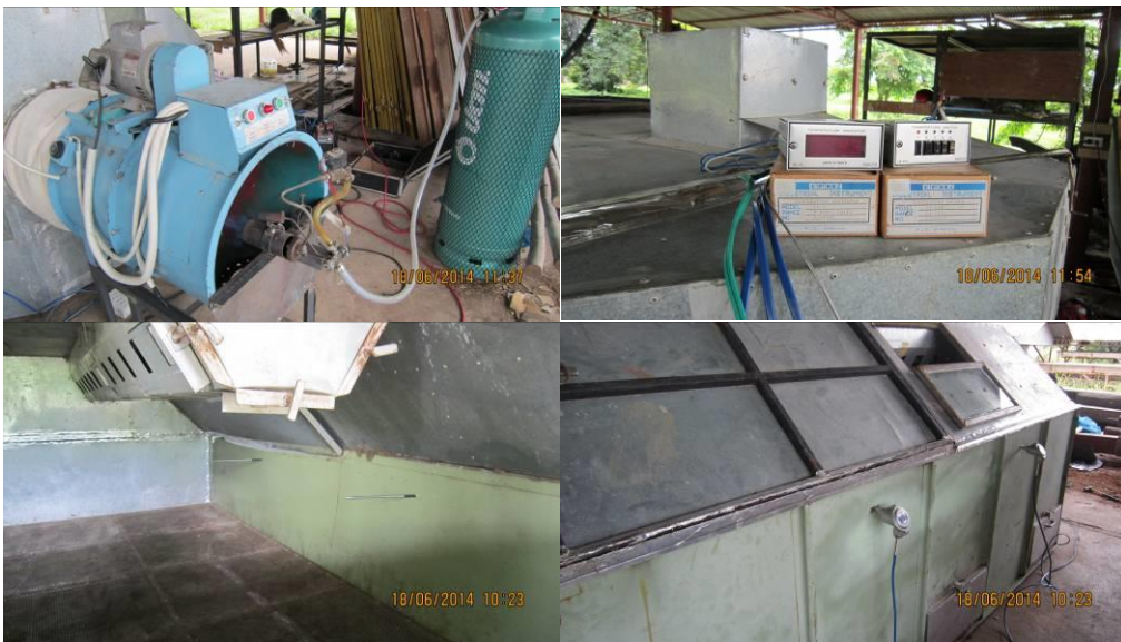
ภาพที่ 3 ลักษณะการติดตั้งหัวพ่นแก๊สกำเนิดความร้อนในห้องอบ และการติดตั้งชุดหัววัดอุณหภูมิในห้องอบลดความชื้นฝักถั่วลิสง