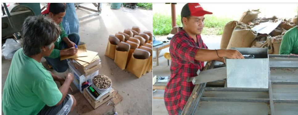
ภาพที่ 5 การสุ่มตัวอย่างเพื่อหาความชื้นฝักถั่วลิสงในแต่ละช่วงเวลา และการวัดอุณหภูมิลมร้อน