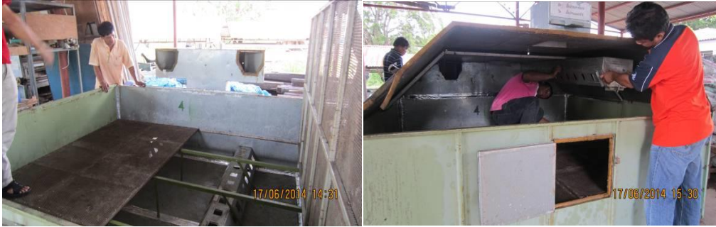
ภาพที่ 2 การติดตั้ง ประกอบเครื่องอบแห้งแบบกระบะสลับทิศทางลมร้อน (บน-ล่าง)

ติดตั้งเครื่องอบแห้งแบบกระบะสลับทิศทางลมร้อน โดยใช้เชื้อเพลิงจากแก๊สแอลพีจี เป็นตัวกำเนิดความร้อน โดยทำการศึกษาลดความชื้นฝักถั่วลิสงพันธุ์ ไทนาน 9 จากแปลงเกษตรกร จังหวัดกาฬสินธุ์ และติดตั้งเครื่องอบแห้งไว้ที่ศูนย์วิจัยและพัฒนาการเกษตรกาฬสินธุ์ (ดังภาพประกอบ)