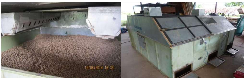
ภาพที่ 4 เครื่องอบแห้งแบบกระบะสลับทิศทางลมร้อนสำหรับทดสอบลดความชื้นฝักถั่วลิสง