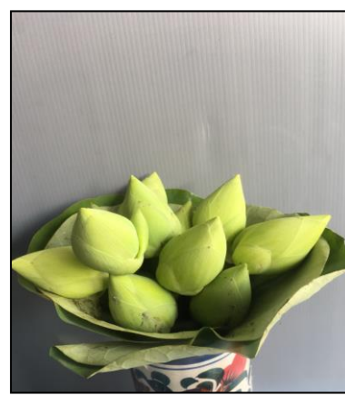
สายต้นขาวสงขลา (SKL.Wh.Sto.54-02)