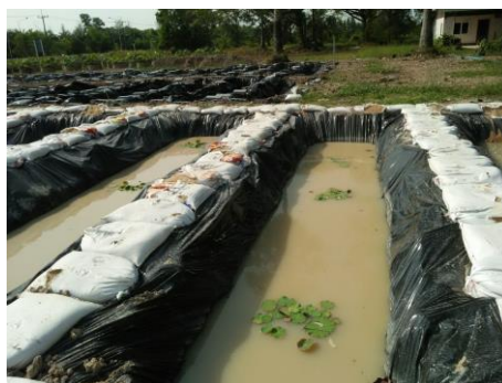
ภาพผนวกที่ 1 สภาพบ่อวิจัยเปรียบเทียบพันธุ์บัวหลวงเพื่อการผลิตดอก