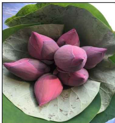
สายต้นกระปี่ 26