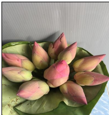
สายต้นแดงแพร์ 45 (Bang Pa-La Sto.53-45)