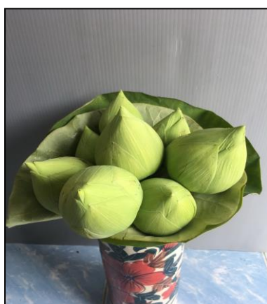
สายต้นพญาจันทร์ขาว (PTL.R.Sto.53-26)