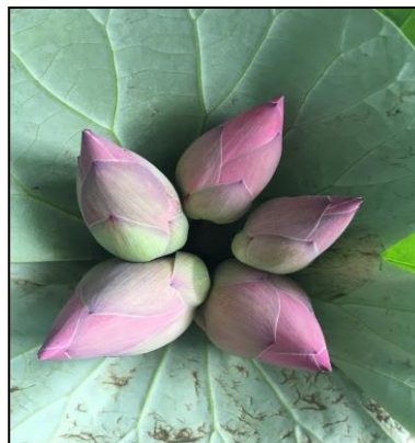
สายต้นแดงทะเลน้อย (PTL.R>Sto.52-07)