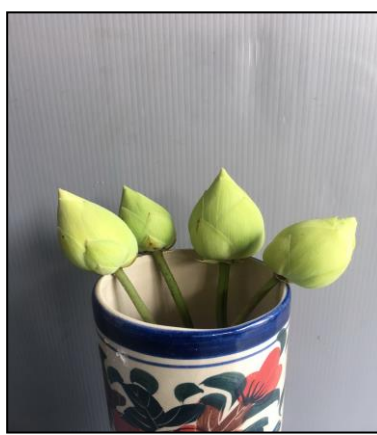
สายต้นนครพนม 10