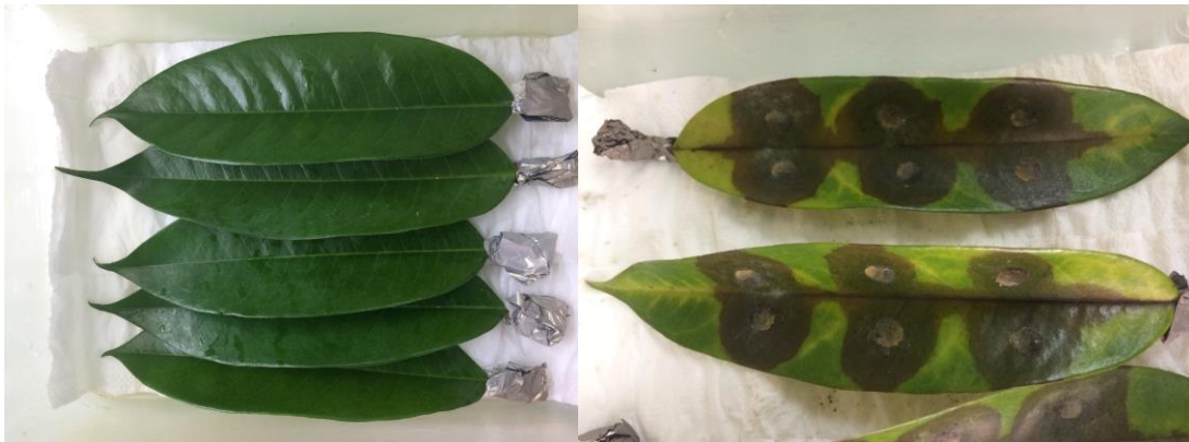
ภาพที่ 2 ลักษณะการเกิดโรคกับใบทุเรียนพันธุ์หมอนทอง ของเชื้อราสาเหตุโรครากเน่าโคนเน่า