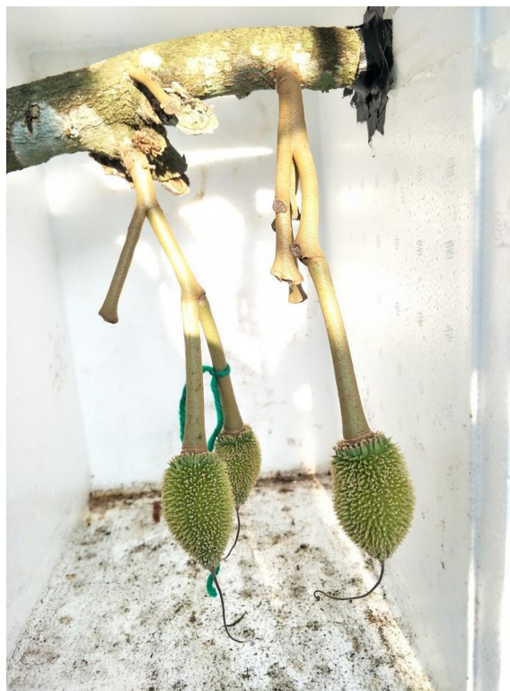
Figure 4 Fruit of Durian when pollination with 'Chanthaburi 3' durian and 'Monthong' durian