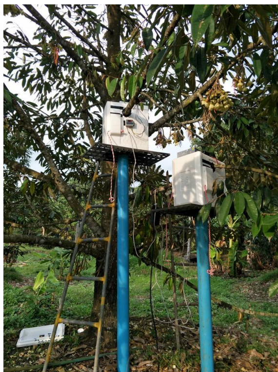
Figure 2 Installation of temperature control equipment on the 'Monthong' durian tree