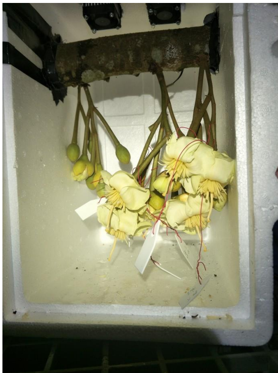
Figure 3 'Monthong' durian when pollination with 'Chanthaburi 3' at 15, 30, 35 °C