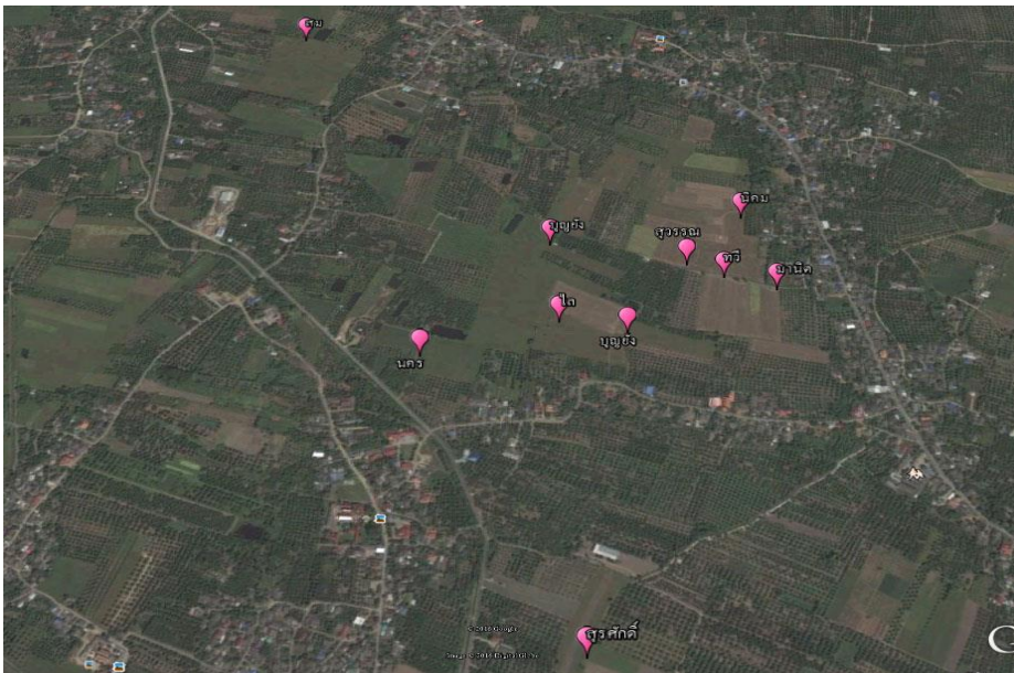
ภาพที่ 3 พิกัดแปลงทดสอบระบบข้าว-ถั่วเหลือง ต.มะขามหลวง อ.สันป่าตอง จ.เชียงใหม่

คัดเลือกพื้นที่เกษตรกร จำนวน 10 รายในพื้นที่ ต.มะขามหลวง อ.สันป่าตอง จ.เชียงใหม่ การวิเคราะห์ประเด็นปัญหาในระบบการปลูกพืชในพื้นที่นา ผลจากการจัดเวทีร่วมกับเกษตรกรพื้นที่เป้าหมายเพื่อวิเคราะห์ประเด็นปัญหาในระบบการปลูก ข้าว-ถั่วเหลือง พบว่า 1) ด้านสภาพแวดล้อม พบการสะสมของวัชพืชในแปลงรุนแรง เกษตรกรบางรายขาดแคลนน้ำใช้ในไร่นาช่วงฤดูแล้ง 2) ด้านปัจจัยการผลิต การใช้ปัจจัยการผลิต โดยเฉพาะปุ๋ยเคมีและสารเคมียังไม่เหมาะสม ปัจจัยการผลิตราคาแพง 3) ขาดแคลนแรงงานและแรงงานราคาแพง ในด้านศักยภาพพบว่าหลังจากเก็บเกี่ยวถั่วเหลืองแล้วเกษตรกรปลูกพืชเสริมรายได้ เช่น แตงไทยหรือพืชผัก