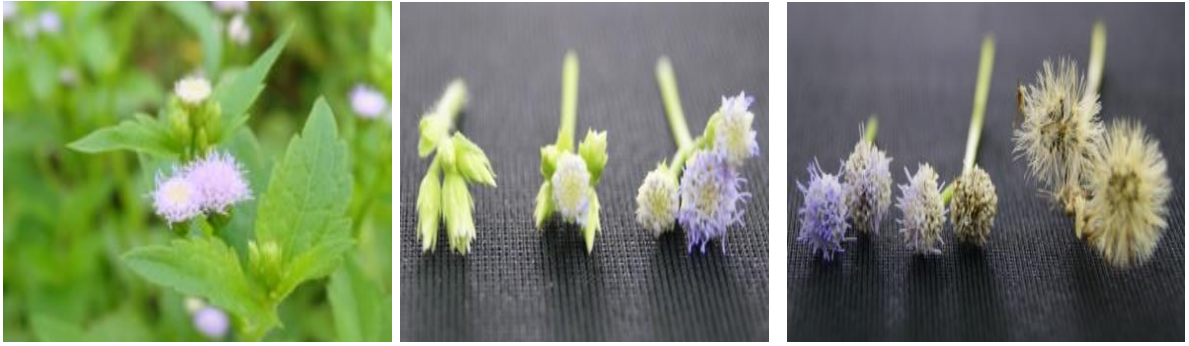
ภาพที่ 1. ลักษณะของดอกสาบม่วงจนถึงติดเมล็ด