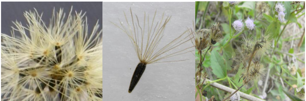
ภาพที่ 2. ลักษณะของเมล็ดสาบม่วง