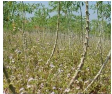
ภาพที่ 4. การแพร่กระจายของสาบม่วงในแปลงยางพารา สับปะรดและมันสำปะหลัง