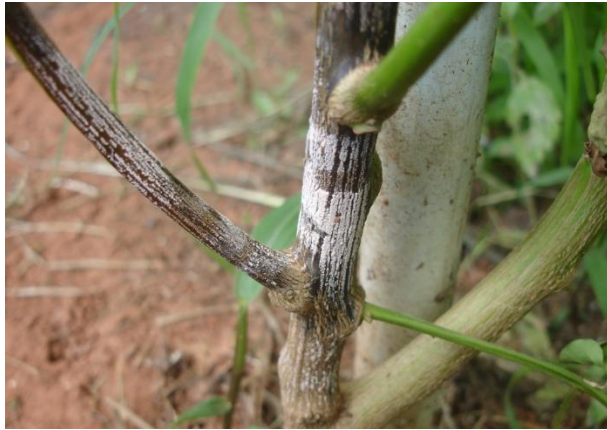
ปัญหา Fusarium ในพริก อ.เมือง จ.พัทลุง