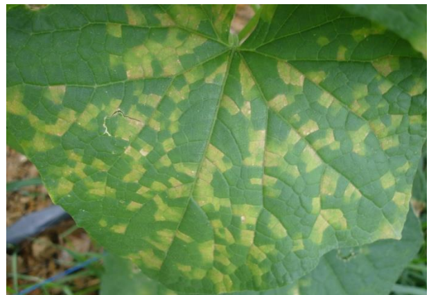
ปัญหาราน้ำค้ำไนตาง อ.หาดสำราญ จ.ตรัง