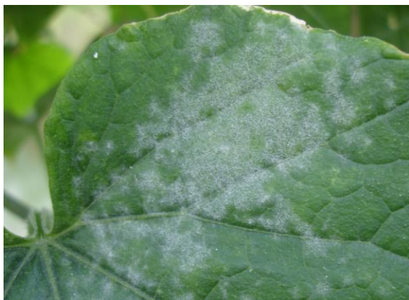
ปัญหาารแบ่งไนตาง อ.ระโนด จ.สงขลา