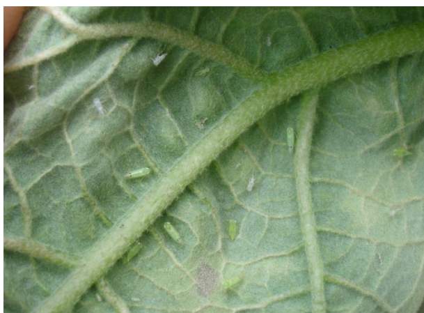
ปัญหาเพ็ญจักจั่น อ.ระโนด จ.สงขลา