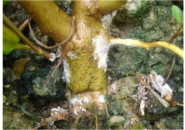
ปัญหา Sclerotium ในพริก อ.เมือง จ.พัทลุง