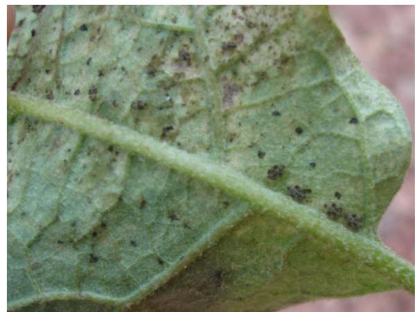
ปัญหามวนแก้วมะเขือ อ.หาดสำราญ จ.ตรัง