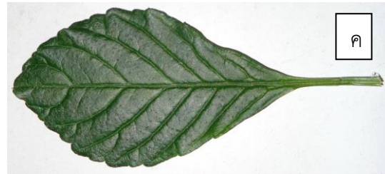
ภาพที่ 4 ลักษณะต้น (ก) ใบประกอบ (ข) และใบแรกที่ใหญ่ที่สุด (ค) ของปัญญาจันทร์พันธุ์พื้นเมือง สันกำแพง x สิบสองปันนาซึ่งมีลักษณะเด่นคือใบประกอบ 1 ใบแยกเป็นใบย่อย 7 ใบ