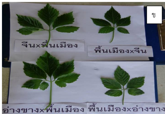
ภาพที่ 1 ลักษณะใบปัญญาจันทร์พันธุ์อ่างขวาง จีน พันเมืองสันกำแพง (ก) และพันธุ์ลูกผสม (ข)