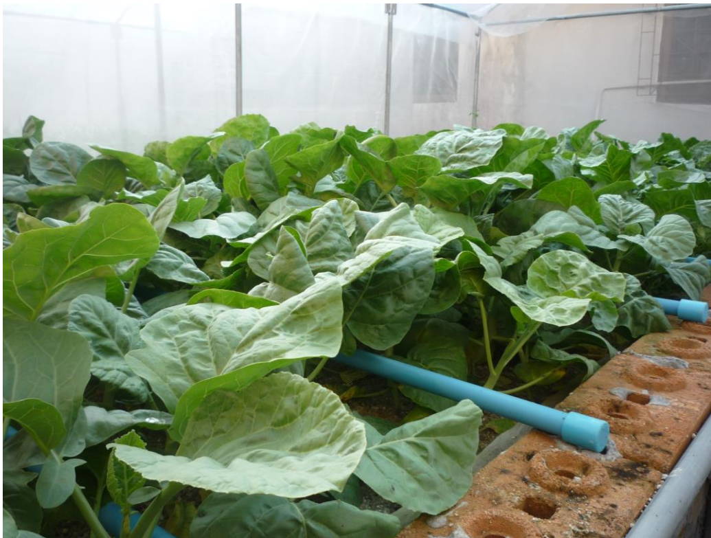
รูปภาพผนวกที่ 4 ปลุกผักคะน้าในโรงเรือนชุมชนคอหงส์