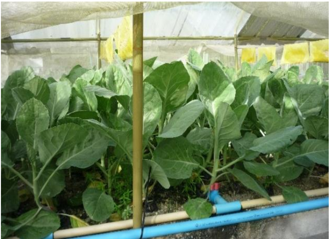
รูปภาพผนวกที่ 2 ปลุกผักคะน้าในโรงเรือนต้นแบบ