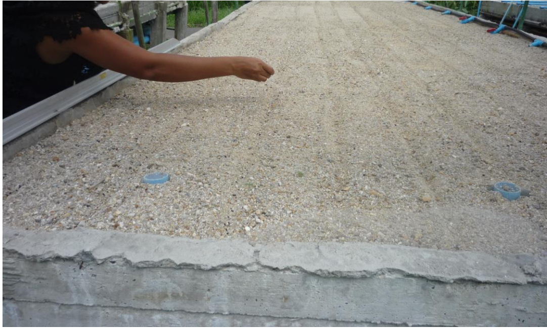
รูปภาพผนวกที่ 1 การกรีดแนวร่องโรยเมล็ด