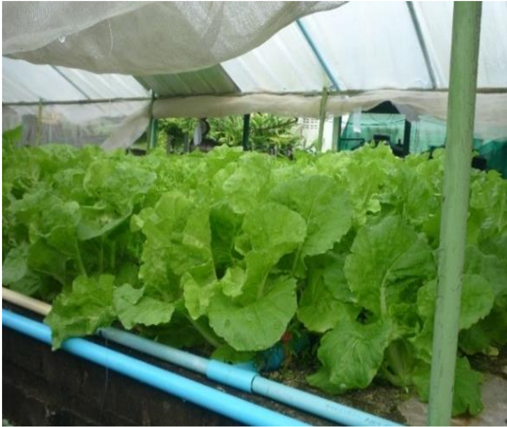
รูปภาพผนวกที่ 3 ปลุกผักกาดขาวในโรงเรือนต้นแบบ