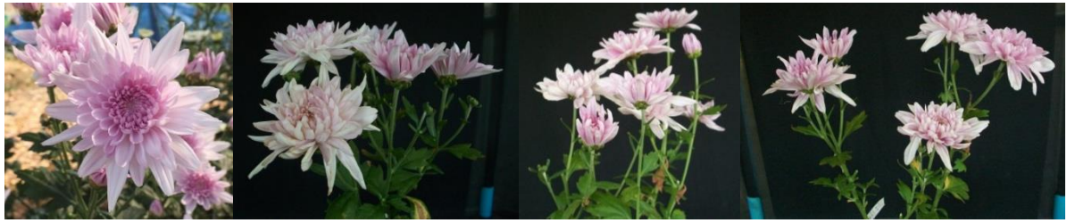
เรโซมี T5 MV0