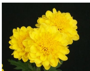
เหลืองยะลารุ่น T2 MV0 (กระถาง)