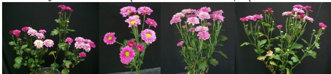
ม่วงยะลา T1 MV0