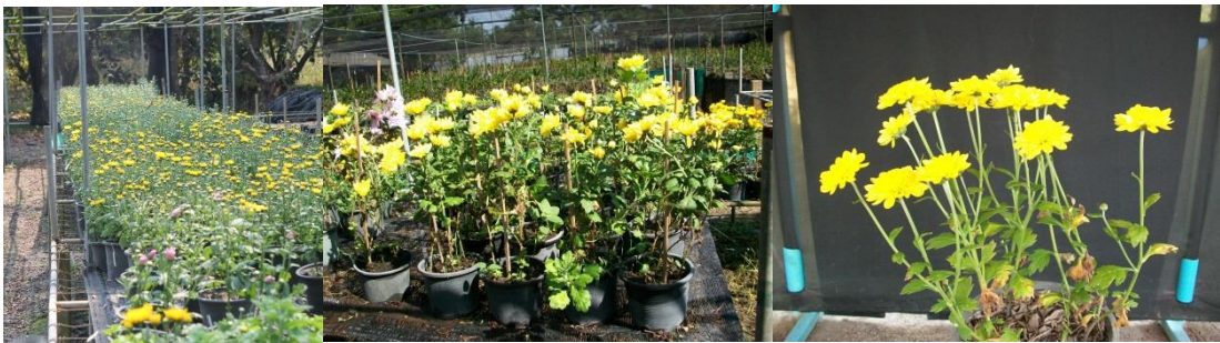
สภาพแสงพรางแสง 50 %