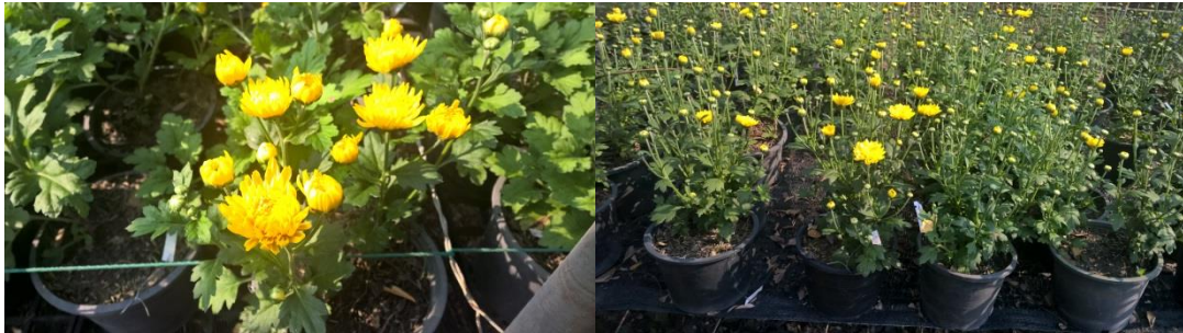
สภาพแสงพรางแสง 80-100 %

2. สภาพความชื้นในอากาศ พบว่า หากเบญจมาศกระถางเมื่อปลูกไว้กลางแจ้ง จะควบคุมความชื้นในอากาศได้ยากกว่าในโรงเรือน เมื่ออากาศร้อน มีลมร้อนพัดผ่านในบริเวณปลูกเลี้ยงจะทำให้ชื้นทำให้ใบเบญจมาศแห้ง และร่วงจำนวนมาก ทำให้ต้นเบญจมาศในกระถางมีสภาพไม่พร้อมจำหน่าย ควรเลือกปลูกในพื้นที่ที่มีสภาพควบคุมอุณหภูมิและความชื้นในอากาศให้สม่ำเสมอทั้งวัน โดยอาจเพิ่มการบังลมร้อนด้วยอาจใช้ซาแลนปิดรอบบริเวณที่ปลูก และรด/พ่นน้ำในช่วงอากาศเป็นช่วง ๆ เพื่อเพิ่มความชื้นในอากาศและลดอุณหภูมิในช่วงกลางวัน จะช่วยให้ต้นเบญจมาศมีสภาพที่สวยพร้อมจำหน่าย