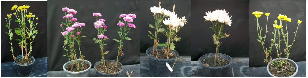
ภาพที่ 8 อาการใบไหม้ ร่วง ของเบญจมาศกระถางที่คัดเลือกไว้ในปี 2558 -2559

ดังนั้นสภาพในการเพาะเลี้ยงเบญจมาศกระถางมีผลต่อผลผลิตที่ได้มาก โดยศูนย์วิจัยพืชสวนศรีสะเกษไม่ใช้สารควบคุมการเจริญโตในการบังคับให้ต้นเตี้ยลง เพื่อให้ได้พันธุ์ที่เตี้ยลงสำหรับไม้กระถางโดยเฉพาะ ทำให้ข้อมูลเบื้องต้นดังนี้