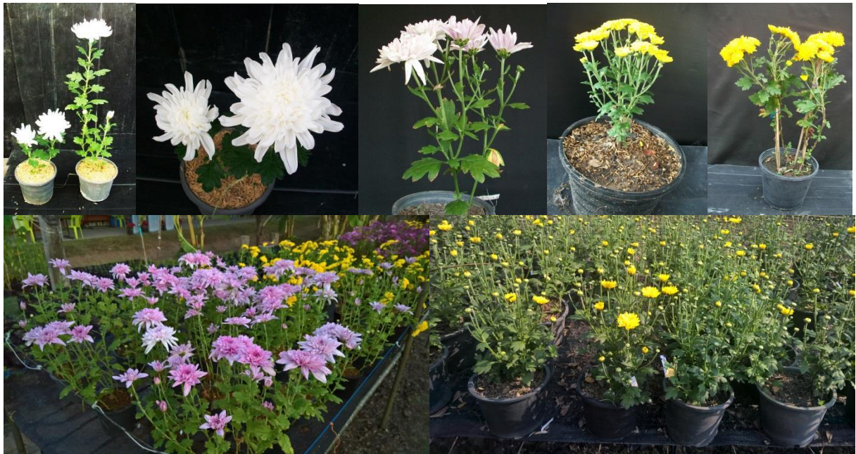
ภาพที่ 7 ต้นเบญจมาศพันธุ์คัดเลือกที่ได้จากการฉายรังสี

2. พันธุ์เบญจมาศกระถาง มีความอ่อนแอโรคและแมลงมากกว่าในเบญจมาศพันธุ์ตัดดอก เนื่องจากสภาพการปลูกเลี้ยงแตกต่างกันมาก เนื่องจาก นอกจากมีดอกที่สวยงามยังต้องปลูกเลี้ยงให้ทรงต้นสมดุลกับกระถางมีใบสวย เรียงต้นเป็นระเบียบ การวางแผนเกินไป หรือรดน้ำมากเกินไปจะส่งผลให้เบญจมาศมีอาการไหม้ และร่วงง่าย ซึ่งทำให้ต้นที่ไม่อยู่ในสภาพจำหน่ายได้ ดังภาพที่ 8