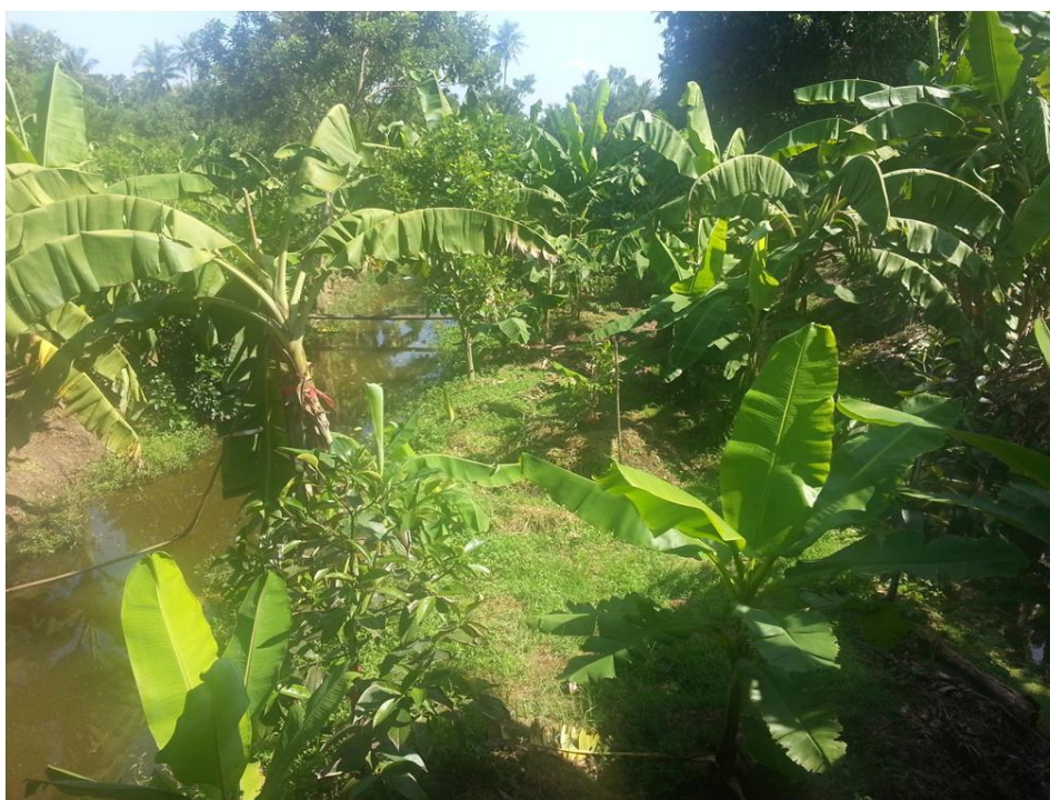
ภาพที่ 1 ลักษณะสวนทุเรียนในจังหวัดนนทบุรี ซึ่งเป็นการปลูกผสมผสานร่วมกับไม้ผลชนิดอื่นๆ