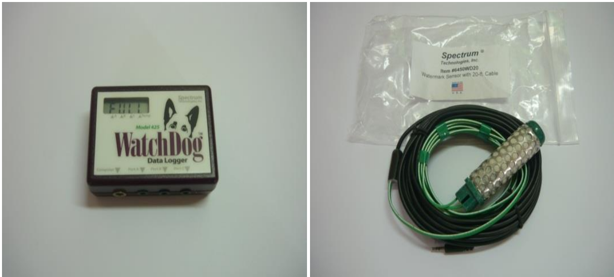
ภาพที่ 4 Watchdog data logger พร้อมหัววัดความชื้นในดิน (Watermark Soil Moisture Sensor)