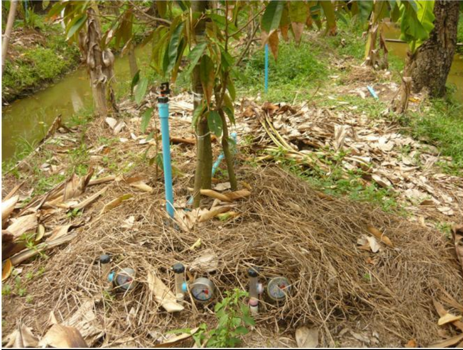
ภาพที่ 3 การติดตั้งTensiometer ที่ใต้ต้นทุเรียน ที่ระดับความลึก 15 30 และ 60 ซม.