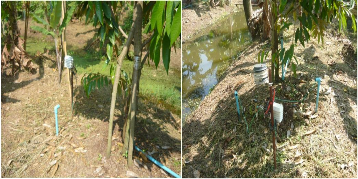
ภาพที่ 5 ลักษณะการติดตั้ง WatchDog Data Logger