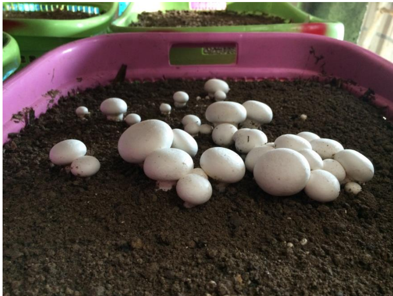
ภาพที่ 2 ทดสอบผลผลิตเห็ดกระดุมแต่ละสายพันธุ์โดยบรรจุวัสดุ เพาะในตะกร้า

ตารางที่ 2 ผลผลิตต่อตะกร้า (กรัม) ของเห็ดกระดุมแต่ละสายพันธุ์