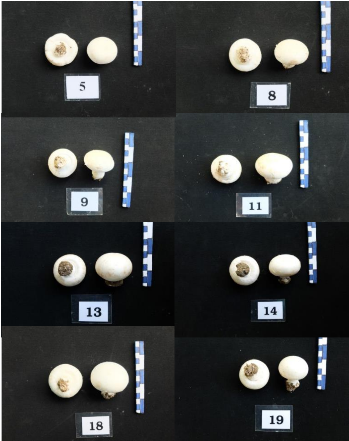
ภาพที่ 6 ลักษณะของดอกเห็ดกระดุมแต่ละสายพันธุ์