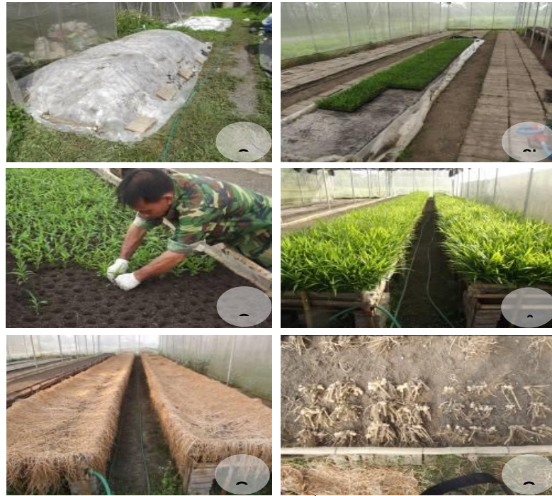
ภาพผนวก 1 การผลิตหัวพันธุ์ชิง G0 รุ่นที่ 1

ก. ข่าเชื้อวัสดุปลูก ข. ต้นกล้าชิงอายุ 1 เดือน ค. ปลูก ง. หลังปลูก 2 เดือน จ. ระยะเก็บเกี่ยว ฉ. ขนาดแ่งที่ปลูก 15X15 ซม. (ซ้าย) และ 7X7 ซม. (ขวา)