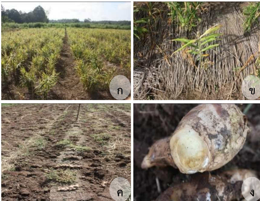
ภาพผนวก 9 การผลิตหัวพันธุ์ชิ่ง G5

ก. แปลงผลิตหัวพันธุ์ G4 อายุ 2 เดือน ข. หัวพันธุ์ที่ได้