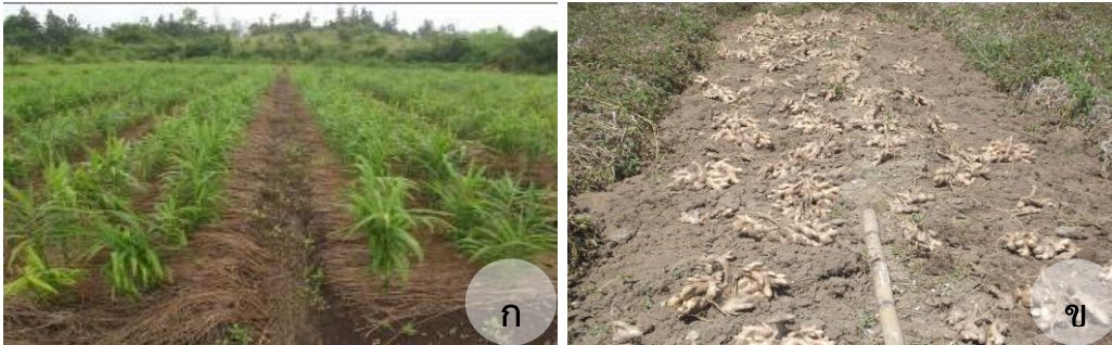
ภาพผนวก 8 การผลิตหัวพันธุ์ชิ่ง G4

ก. แปลงผลิตหัวพันธุ์ G3 อายุ 2 เดือน ข. หัวพันธุ์ที่ได้