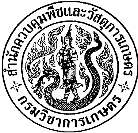
ขนาดขยาย ๒ เท่า