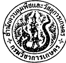
ขนาดเท่าจริงขนาดเส้นผ่าศูนย์กลาง ๓ เซนติเมตร.