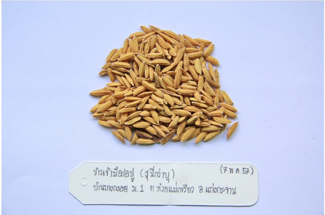
ข้าวเจ้ามือก่อบุ (สุณีกว่าบุ)