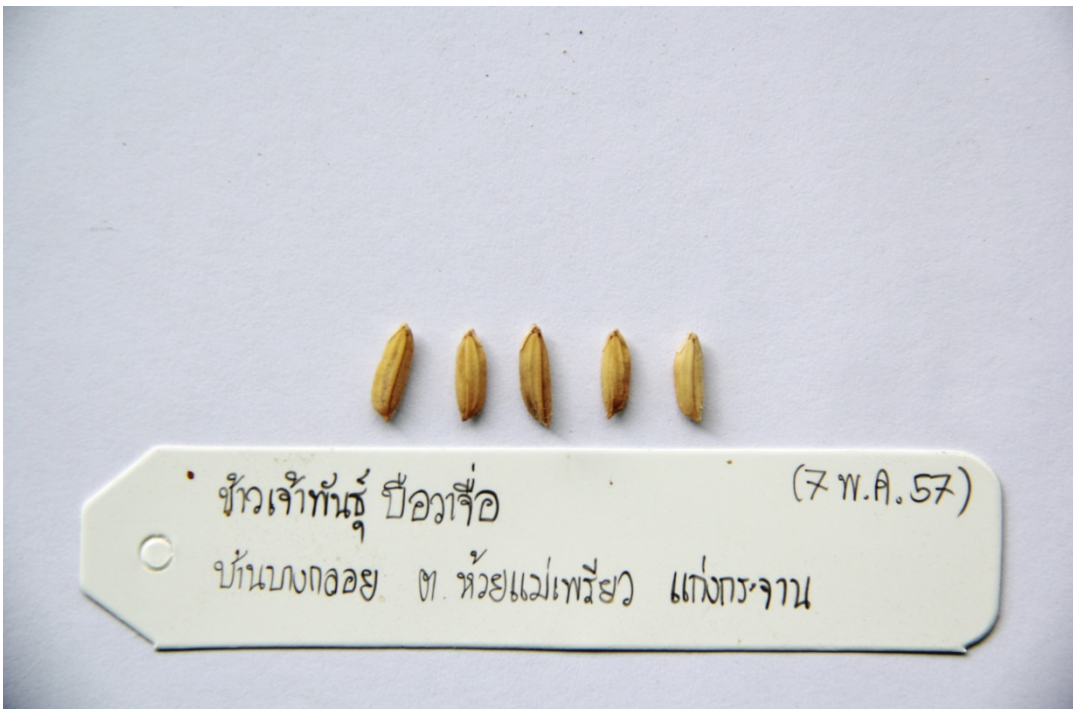
ข้าวเจ้าพันธุ์ป็อวาจื่อ