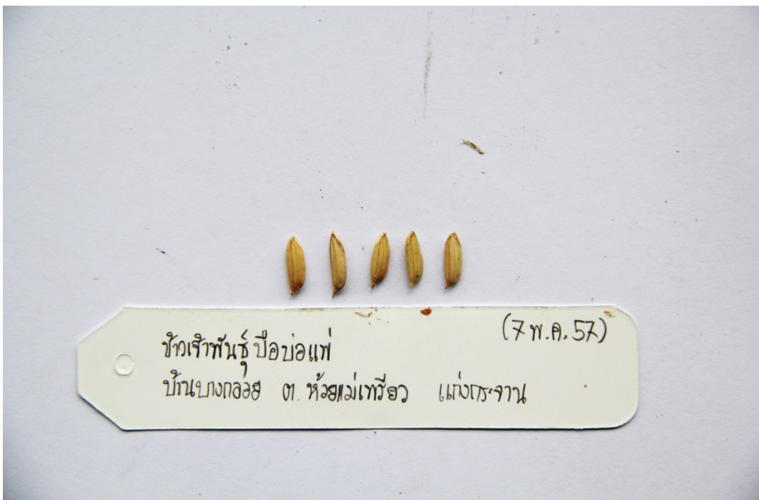
ข้าวเจ้าพันธุ์ป้อบ่อแพ่