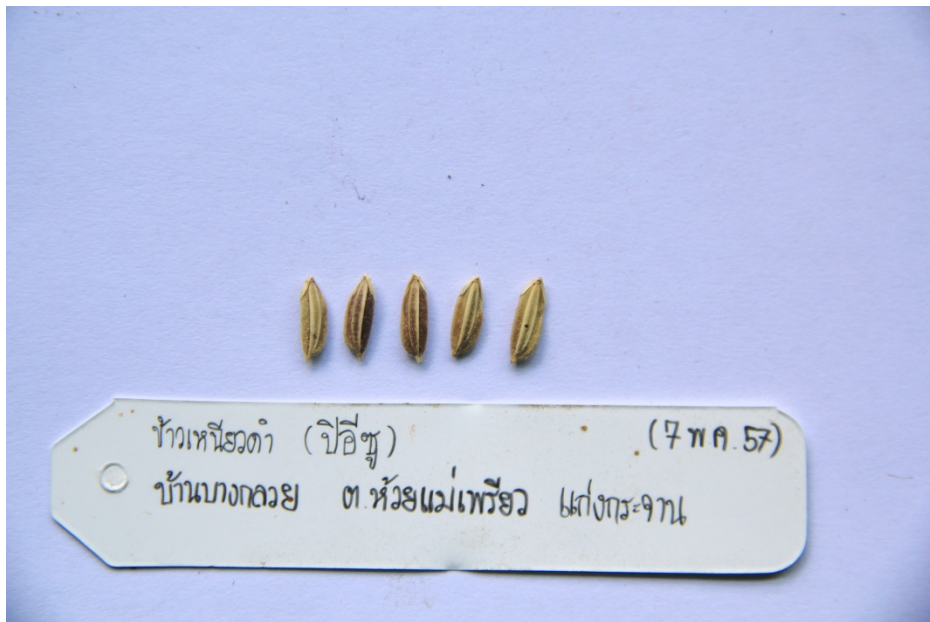
ข้าวเหนียวดำ (ปีอีซู)