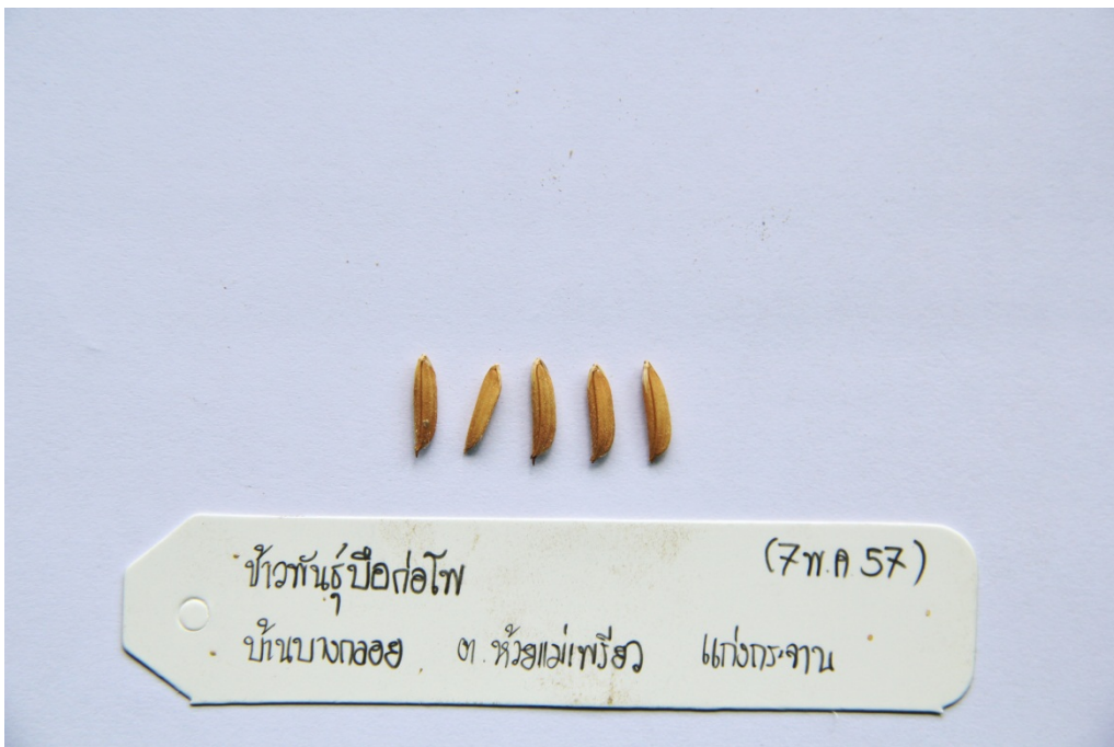
ข้าวพันธุ์ปิ่นตอโพ