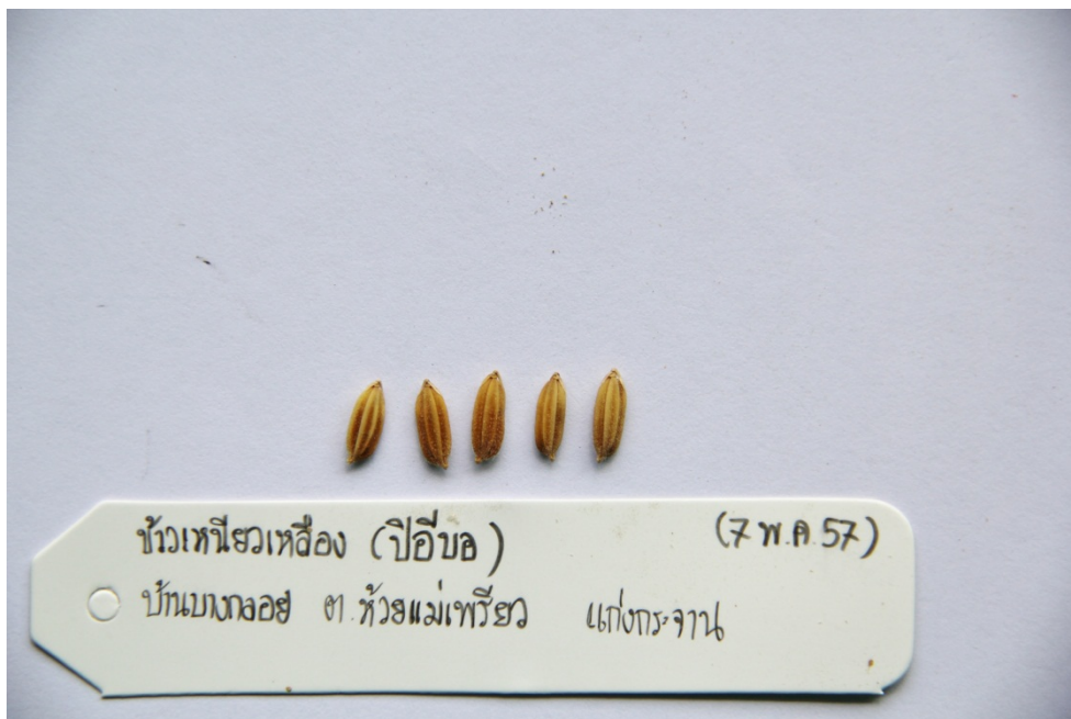
ข้าวเหนียวเหลือง (ปีอีบอ)