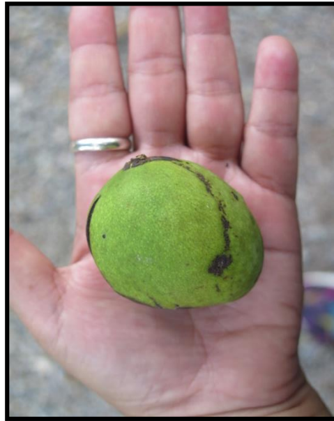
มะม่วงคลุ้ม