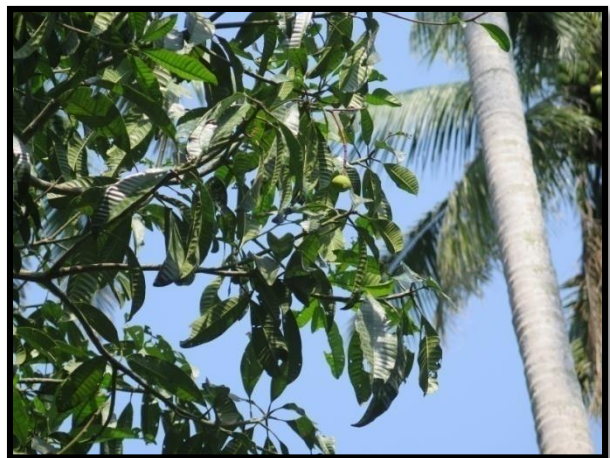
มะม่วงมุด