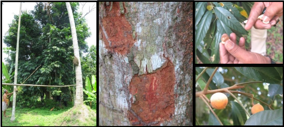
ต้นสังกะโต้ง