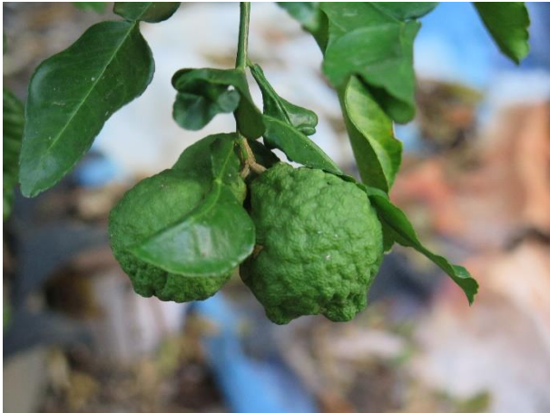
มะกรูดพันธุ์พื้นเมือง