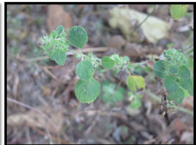
แมงลักป่า