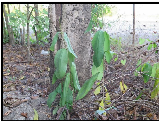
เถาเอ็นอ่อน

พันธุ์พืชพื้นเมืองที่มีการอนุรักษ์ในชุมชน ได้แก่ ผักหวานป่า บุก มะนาว มะกอกป่า มะดัน ผักกูด ใผ่ป่า หนอนตายยาก สบู่เลือด มะเฒ่า เถาเอ็นอ่อน แมงลักป่า เป็นต้น