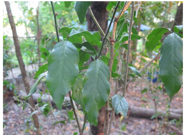
ต้นผักหวานป่า