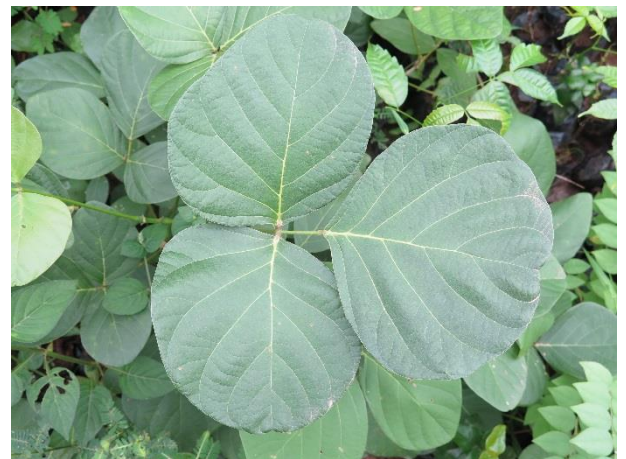
ต้นทองกวาว (ต้นจาม)