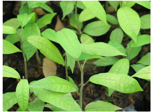
ต้นกระบาก