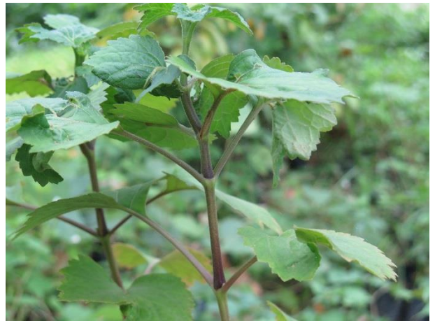
ต้นพืมนเสน