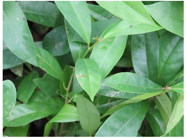
ต้นหมากเฒ่า