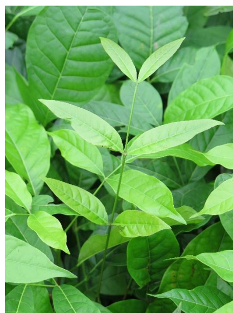
ต้นมะฮอกกานี