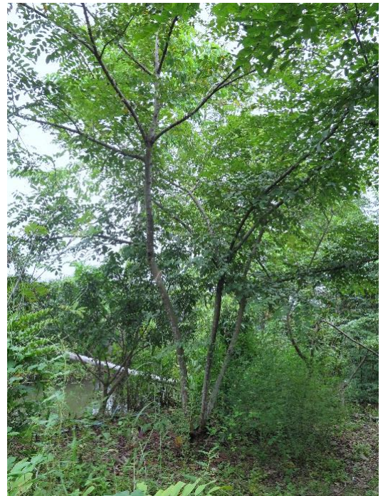
ต้นคูณชมพู