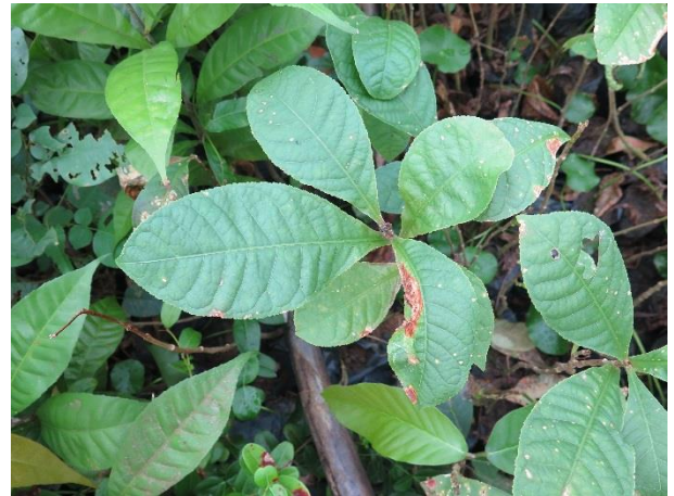
ต้นกระโดน