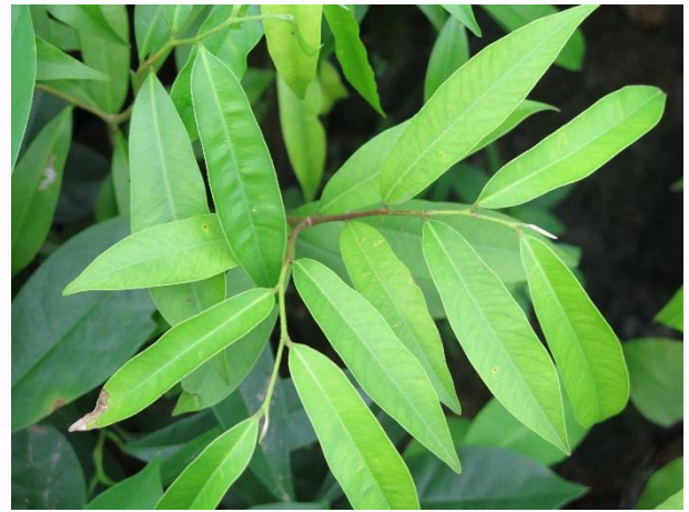
ต้นกฤษณา