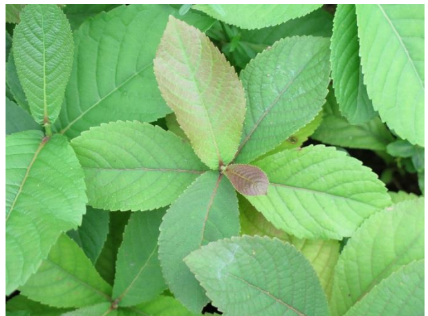
ต้นตะแบกขานาง