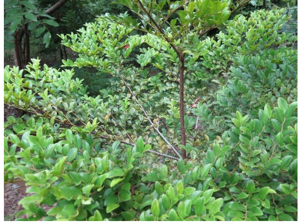
ต้นหูหนู (แม่บารมี)