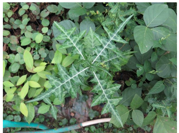
ต้นเหงือกปลาหมอ