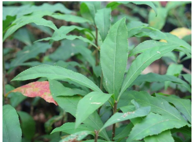
ต้นจิกน้ำ (กระโดนน้ำ)