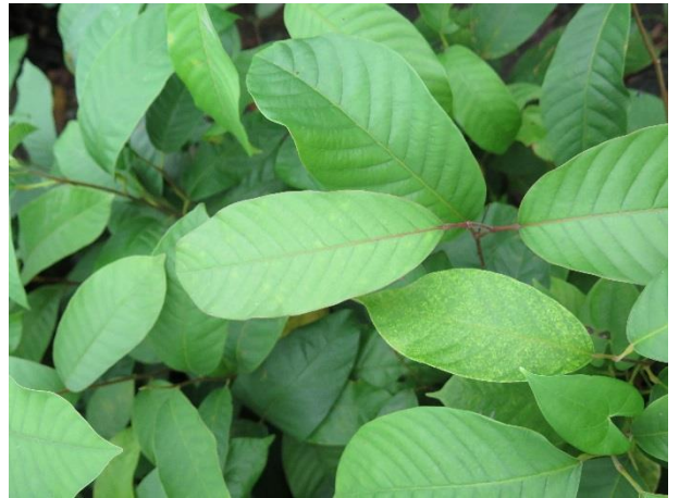
ต้นพะยอม