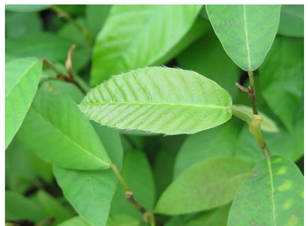
ต้นยางนา