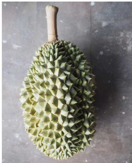
ทุเรียนพันธุ์ชมพู่สี