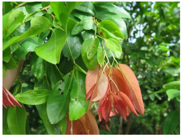
มะขามคางคก