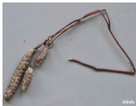
ผักอีหลิน