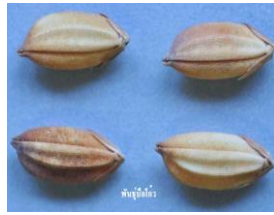
ข้าวพันธุ์ป้อแก้ว