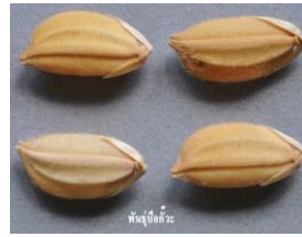
ข้าวพันธุ์ป้อแก้ว