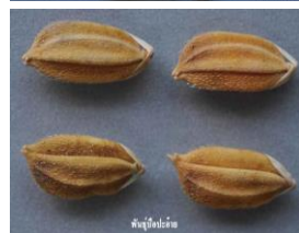
ข้าวพันธุ์ป้อปะอ้าย