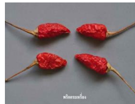
พริกกระเหรียง