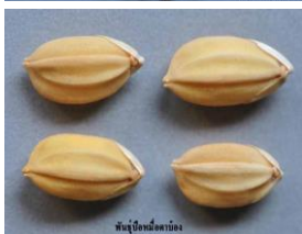
ข้าวพันธุ์ป้อหม้อตาบ้อง