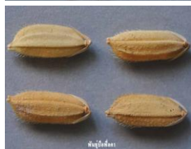
ข้าวพันธุ์ป้อผ้อคา