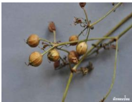
ผักหอมป้อม