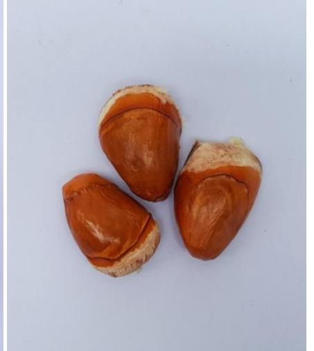
ทุเรียนพันธุ์ศรีสุวรรณ