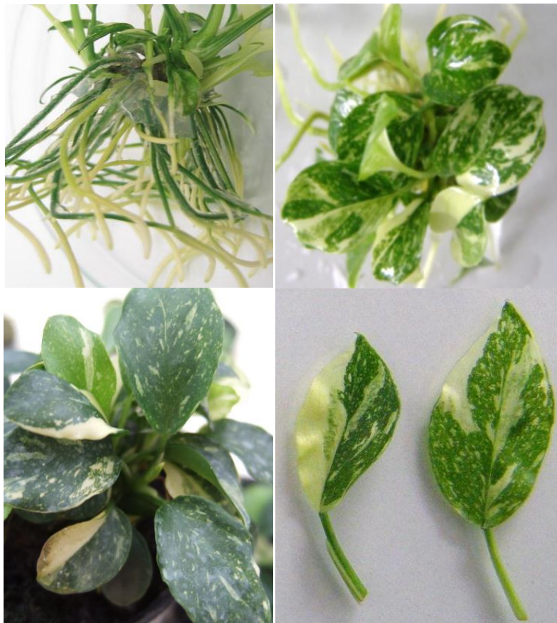
อนูเบียสพันธุ์อ่อนเงิน ๑

พันธุ์กลายที่มีลักษณะต้น ใบ และรากที่หลากหลาย ได้แก่ ต้นแคระ ใบเล็ก ใบและรากสีเขียว ต่าง และขาว