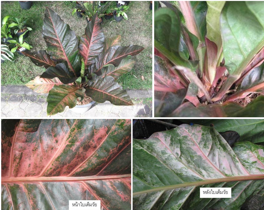
หน้าวัวใบพันธุ์ทับทิมสยาม