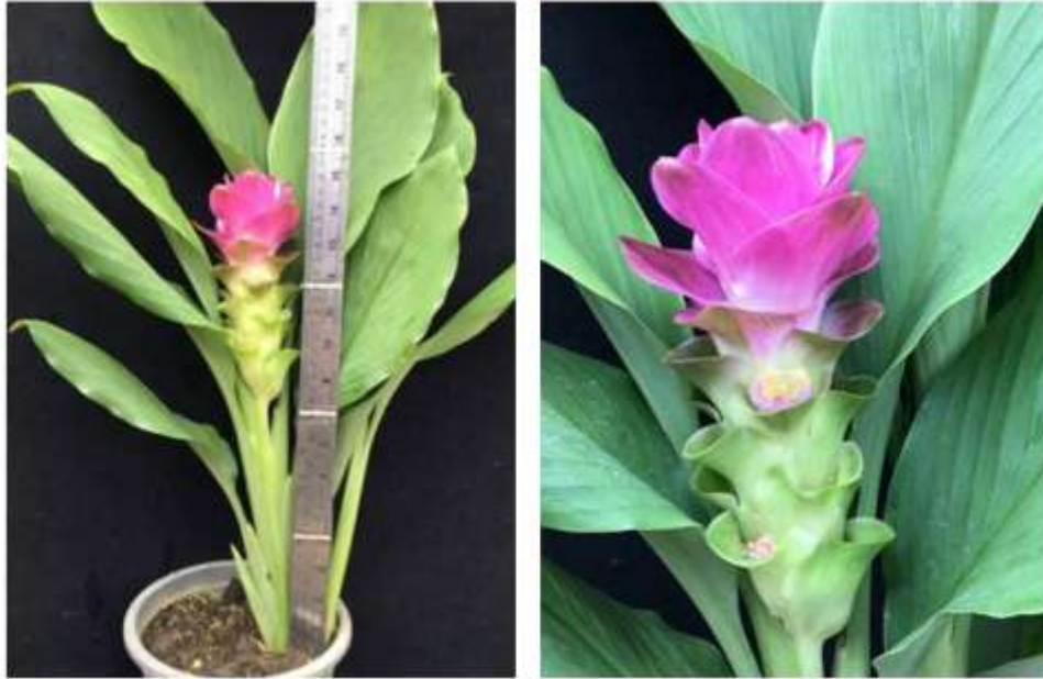
ไม้ดอกสกุลขมิ้น (ลูกผสมปทุมมา) พันธุ์เออาร์เอ็มเจ05 (ARMJ05)