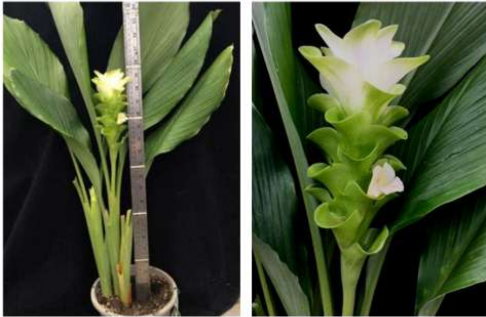
ไม้ดอกสกุลขมิ้น (ลูกผสมปทุมมา) พันธุ์เออาร์เอ็มเจ13 (ARMJ13)