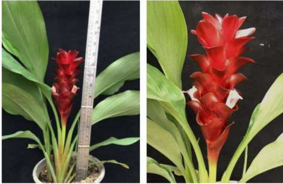
ไม้ดอกสกุลขมิ้น (ลูกผสมปทุมมา) พันธุ์เออาร์เอ็มเจ14 (ARMJ14)