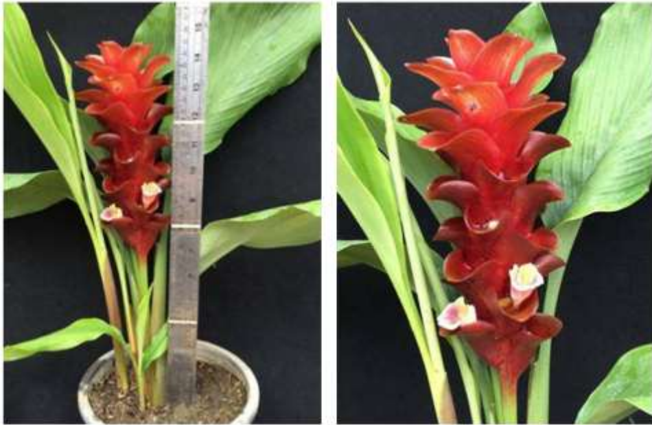
ไม้ดอกสกุลขมิ้น (ลูกผสมปทุมมา) พันธุ์เออาร์เอ็มเจ04 (ARMJ04)