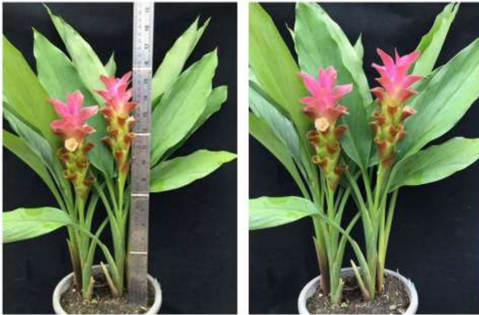
ไม้ดอกสกุลขมิ้น (ลูกผสมปทุมมา) พันธุ์เออาร์เอ็มเจ01 (ARMJ01)