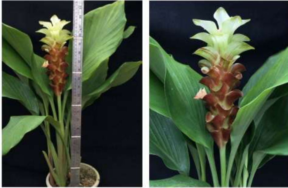
ไม้ดอกสกุลขมิ้น (ลูกผสมปทุมมา) พันธุ์เออาร์เอ็มเจ10 (ARMJ10)