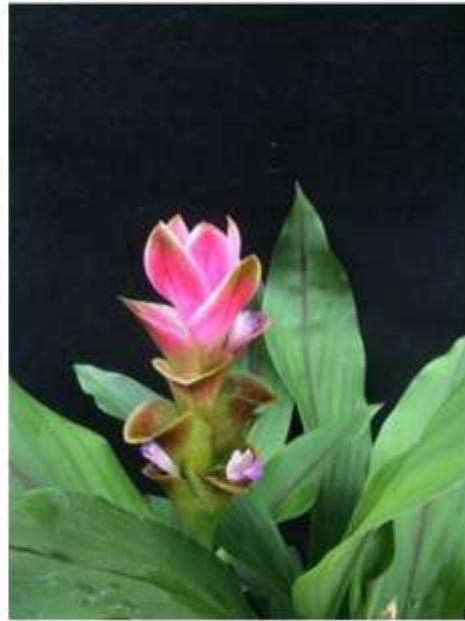
ไม้ดอกสกุลขมิ้น (ลูกผสมปทุมมา) พันธุ์เออาร์เอ็มเจ16 (ARMJ16)