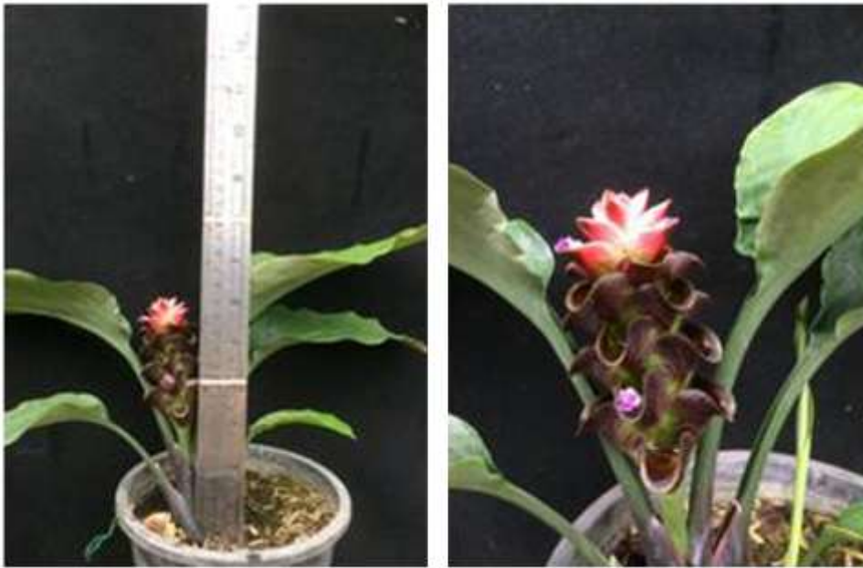
ไม้ดอกสกุลขมิ้น (ลูกผสมปทุมมา) พันธุ์เออาร์เอ็มเจ21 (ARMJ21)