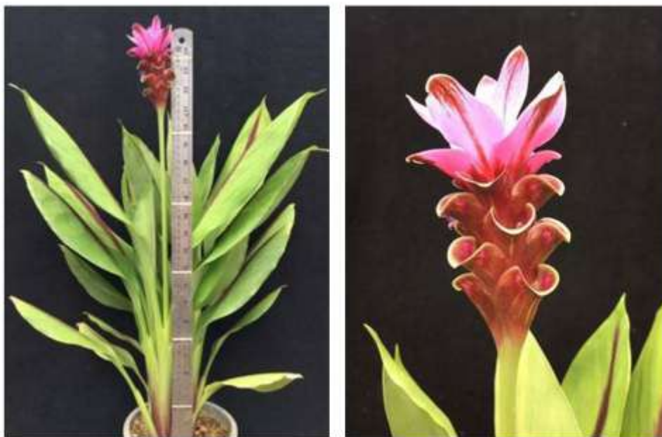
ไม้ดอกสกุลขมิ้น (ลูกผสมปทุมมา) พันธุ์เออาร์เอ็มเจ15 (ARMJ15)