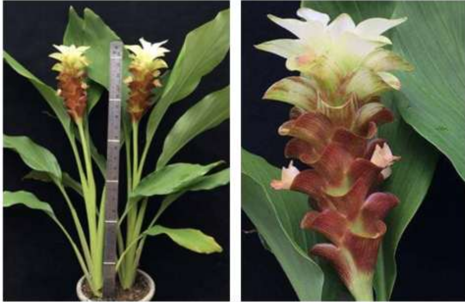
ไม้ดอกสกุลขมิ้น (ลูกผสมปทุมมา) พันธุ์เออาร์เอ็มเจ12 (ARMJ12)