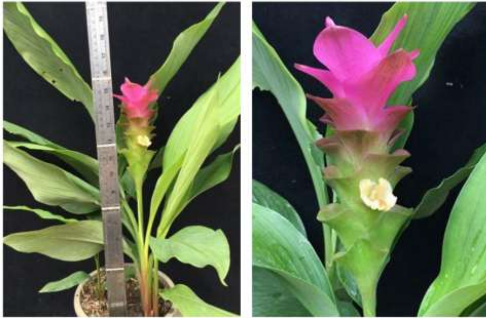
ไม้ดอกสกุลขมิ้น (ลูกผสมปทุมมา) พันธุ์เออาร์เอ็มเจ11 (ARMJ11)