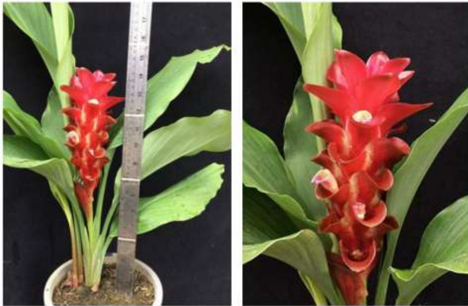
ไม้ดอกสกุลขมิ้น (ลูกผสมปทุมมา) พันธุ์เออาร์เอ็มเจ02 (ARMJ02)