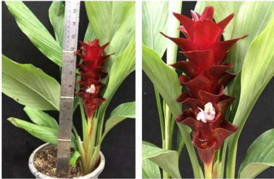
ไม้ดอกสกุลขมิ้น (ลูกผสมปทุมมา) พันธุ์เออาร์เอ็มเจ07 (ARMJ07)