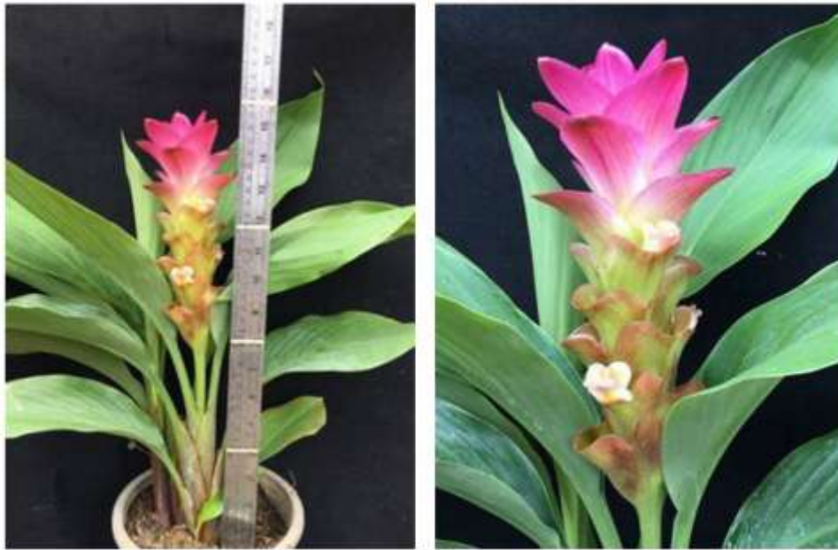
ไม้ดอกสกุลขมิ้น (ลูกผสมปทุมมา) พันธุ์เออาร์เอ็มเจ03 (ARMJ03)