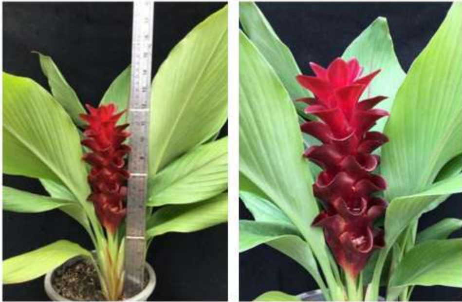
ไม้ดอกสกุลขมิ้น (ลูกผสมปทุมมา) พันธุ์เออาร์เอ็มเจ06 (ARMJ06)