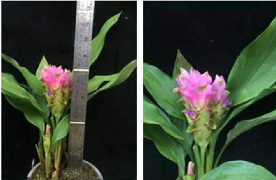
ไม้ดอกสกุลขมิ้น (ลูกผสมปทุมมา) พันธุ์เออาร์เอ็มเจ17 (ARMJ17)