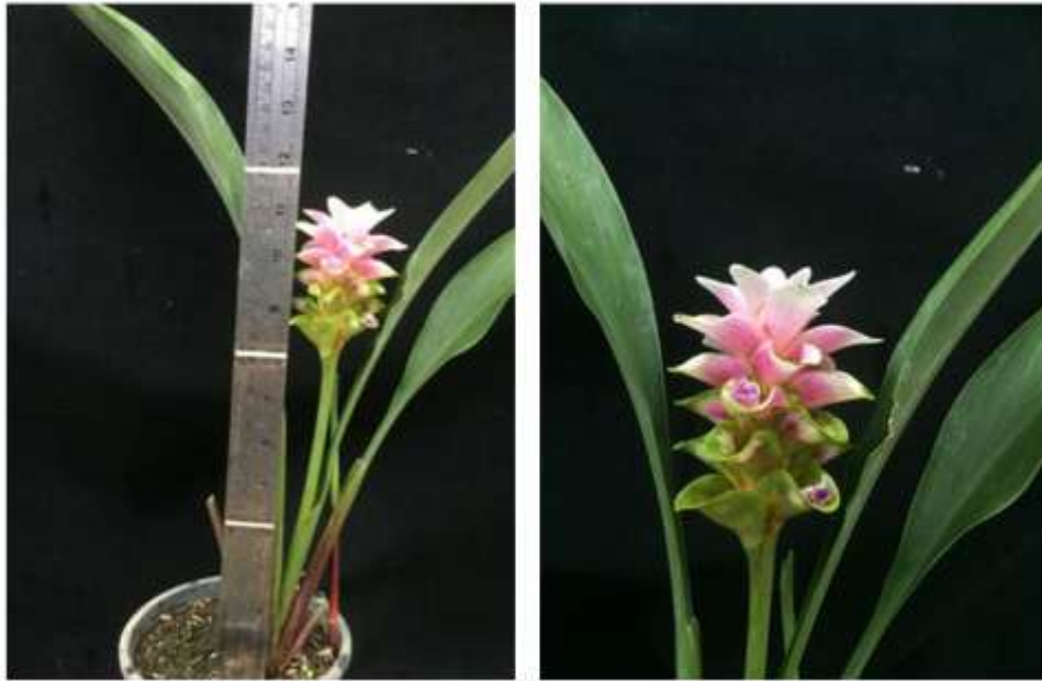
ไม้ดอกสกุลขมิ้น (ลูกผสมปทุมมา) พันธุ์เออาร์เอ็มเจ19 (ARMJ19)