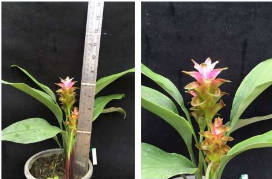
ไม้ดอกสกุลขมิ้น (ลูกผสมปทุมมา) พันธุ์เออาร์เอ็มเจ18 (ARMJ18)