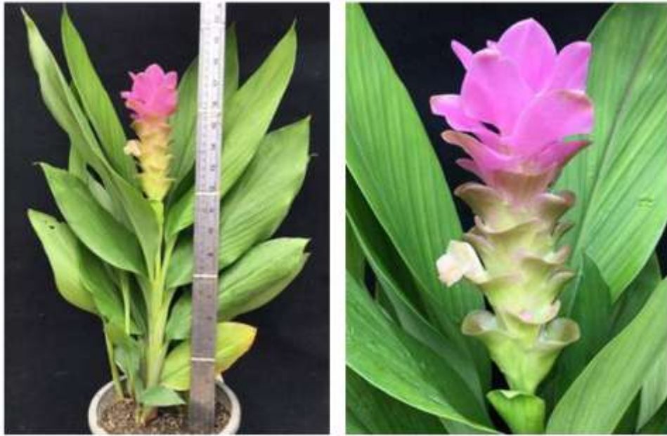
ไม้ดอกสกุลขมิ้น (ลูกผสมปทุมมา) พันธุ์เออาร์เอ็มเจ09 (ARMJ09)