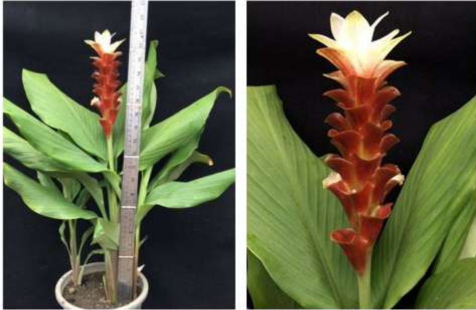
ไม้ดอกสกุลขมิ้น (ลูกผสมปทุมมา) พันธุ์เออาร์เอ็มเจ08 (ARMJ08)