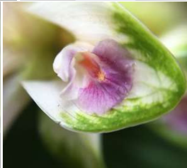
ปทุมมาพันธุ์เซียงรายซีเอฟ 42