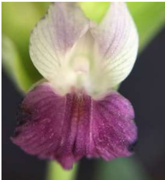
ปทุมมาพันธุ์เชียงใหม่รายซีเอฟ 34