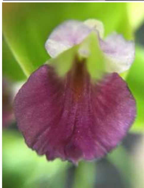
ปทุมมาพันธุ์เชียงใหม่รายซีเอฟ 44