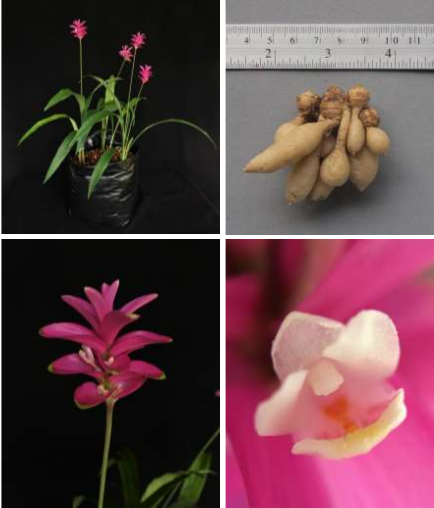
ปทุมมาพันธุ์เชียงใหม่รายซีเอฟ 58/เอ็นเอ