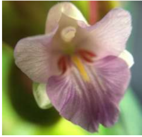
ปทุมมาพันธุ์เซียงรายซีเอฟ 59