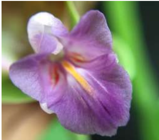
ปทุมมาพันธุ์เซียงรายซีเอฟ 60