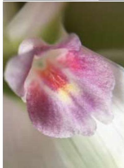
ปทุมมาพันธุ์เซียงรายซีเอฟ 53