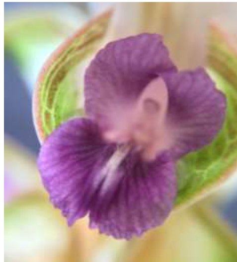
ปทุมมาพันธุ์เชียงใหม่รายซีเอฟ 47