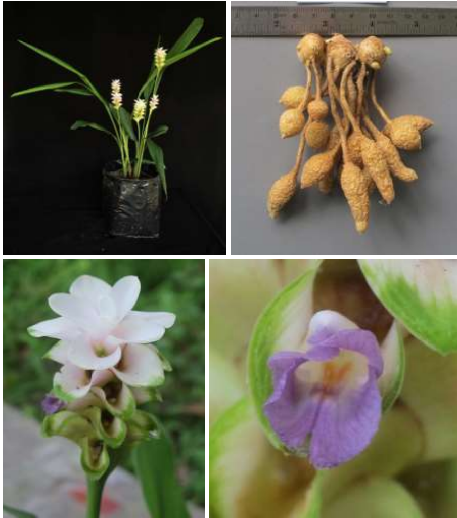
ปทุมมาพันธุ์เซียงรายซีเอฟ 50