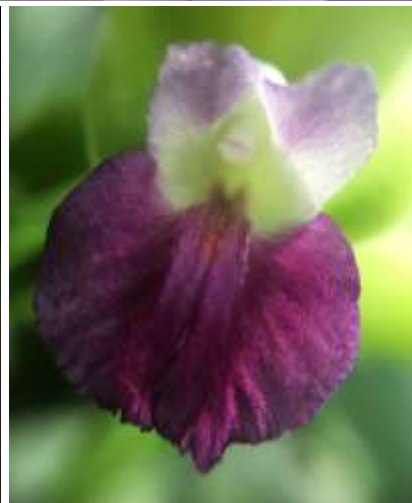
ปทุมมาพันธุ์เซียงรายซีเอฟ 51