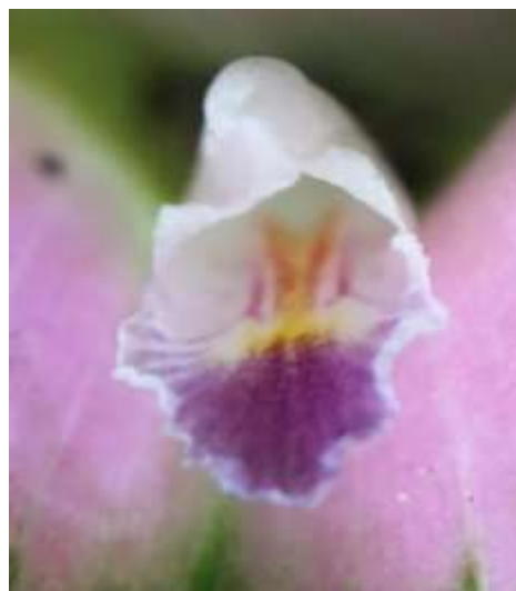
ปทุมมาพันธุ์เชียงใหม่ 32