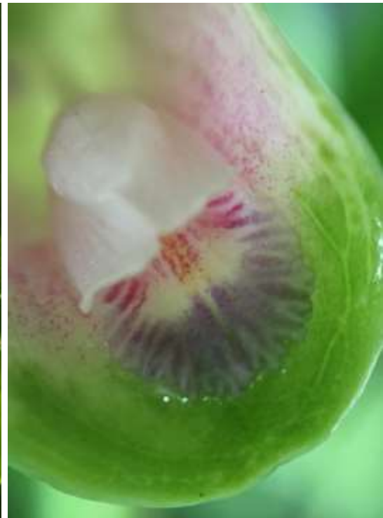
ปทุมมาพันธุ์เซียงรายซีเอฟ 35