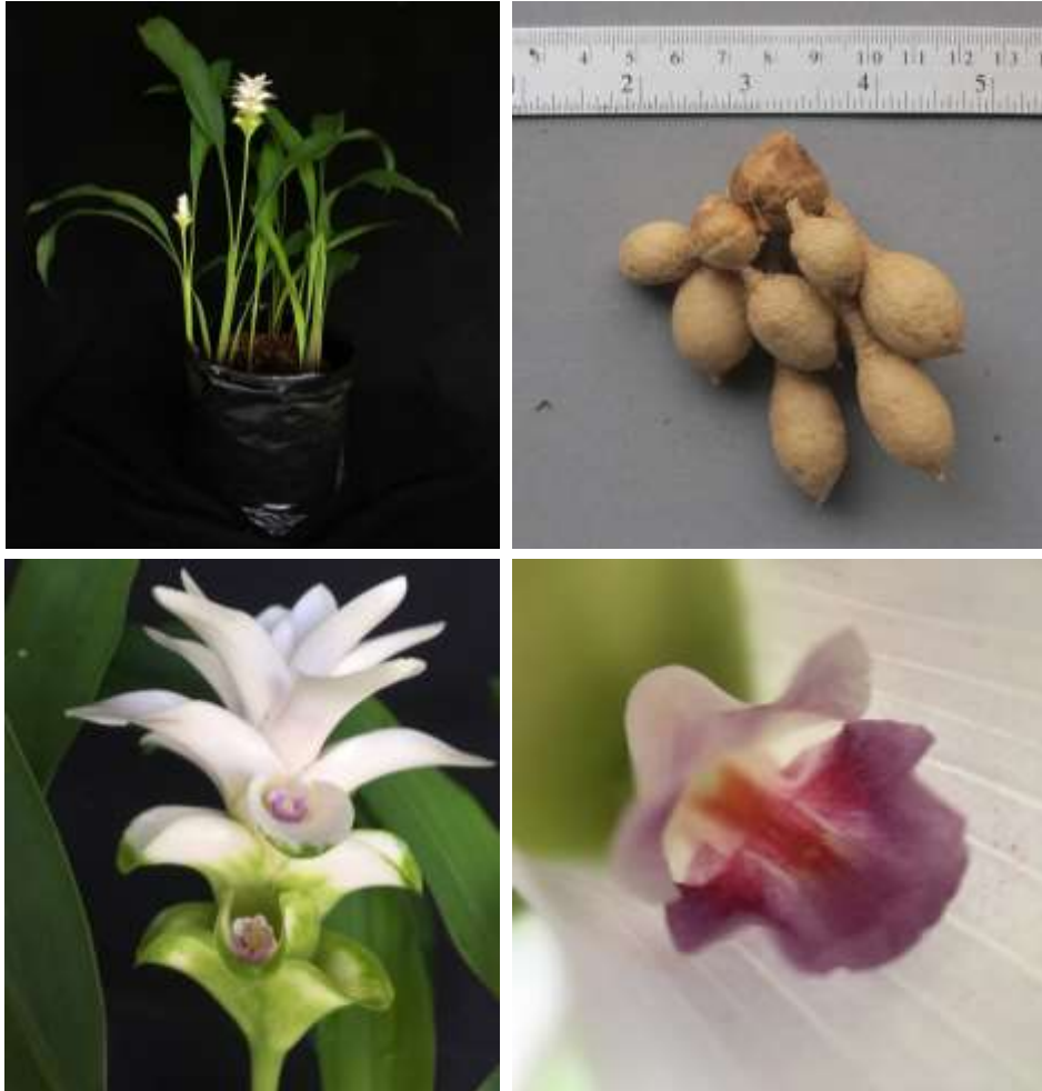
ปทุมมาพันธุ์เซียงรายซีเอฟ 57