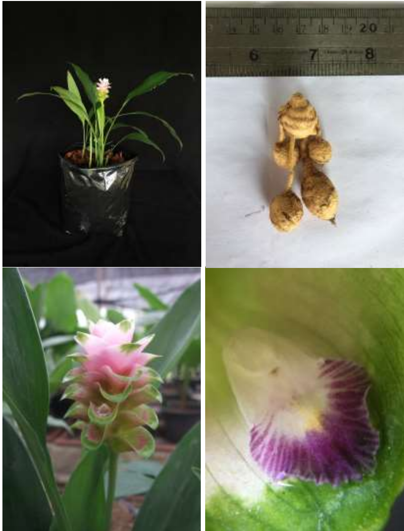
ปทุมมาพันธุ์เซียงรายซีเอฟ 55