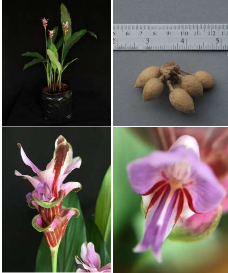
ปทุมมาพันธุ์เชียงใหม่รายซีเอฟ 54