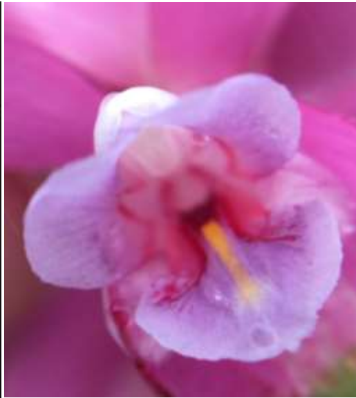
ปทุมมาพันธุ์เชียงใหม่ 40