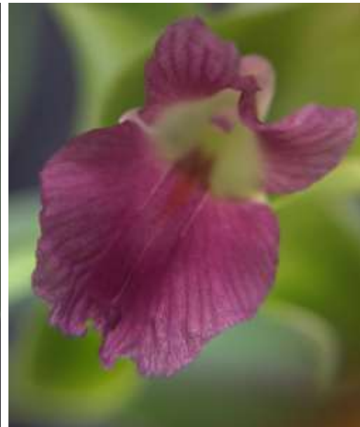
ปทุมมาพันธุ์เซียงรายซีเอฟ 43