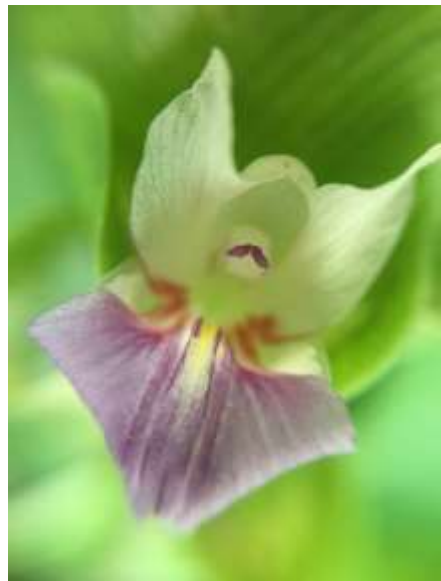
ปทุมมาพันธุ์เซียงรายซีเอฟ 56