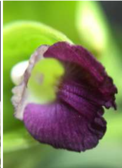
ปทุมมาพันธุ์เชียงใหม่รายซีเอฟ 36