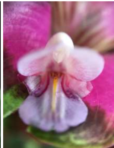
ปทุมมาพันธุ์เชียงใหม่รายซีเอฟ 41