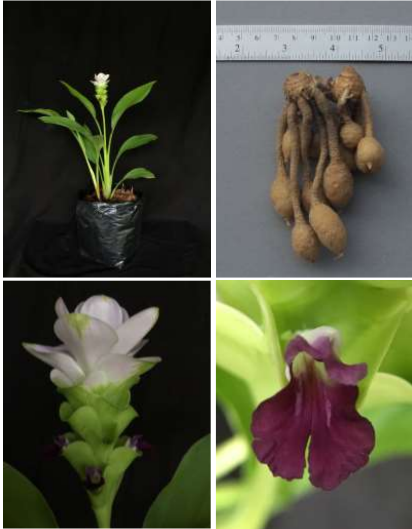
ปทุมมาพันธุ์เซียงรายซีเอฟ 52