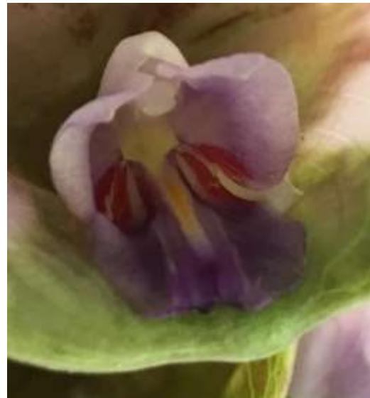
ปทุมมาพันธุ์เชียงใหม่ 37