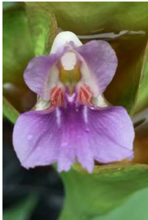
ปทุมมาพันธุ์เชียงใหม่รายซีเอฟ 39