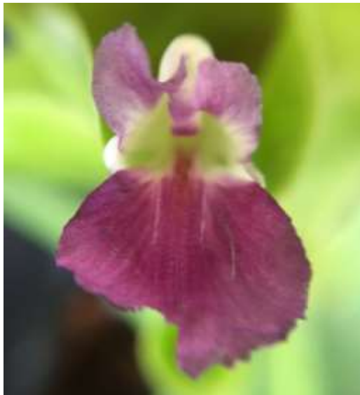
ปทุมมาพันธุ์เซียงรายซีเอฟ 48