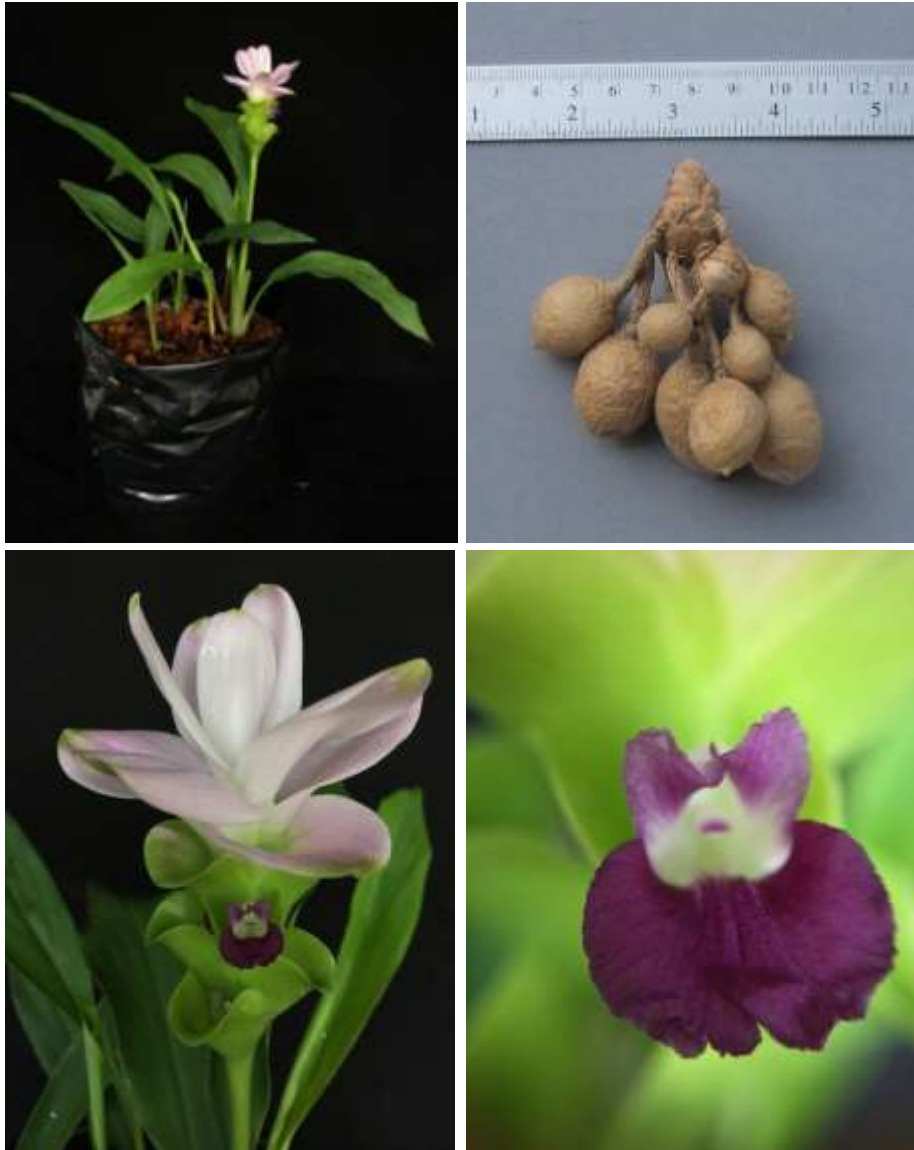
ปทุมมาพันธุ์เซียงรายซีเอฟ 61