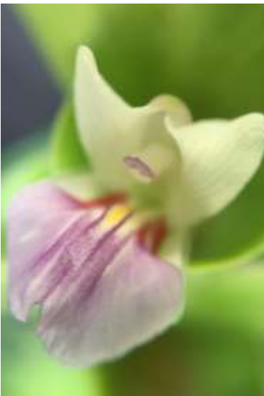
ปทุมมาพันธุ์เชียงใหม่รายซีเอฟ 46