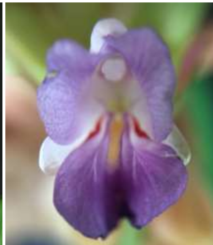
ปทุมมาพันธุ์เชียงใหม่รายซีเอฟ 45