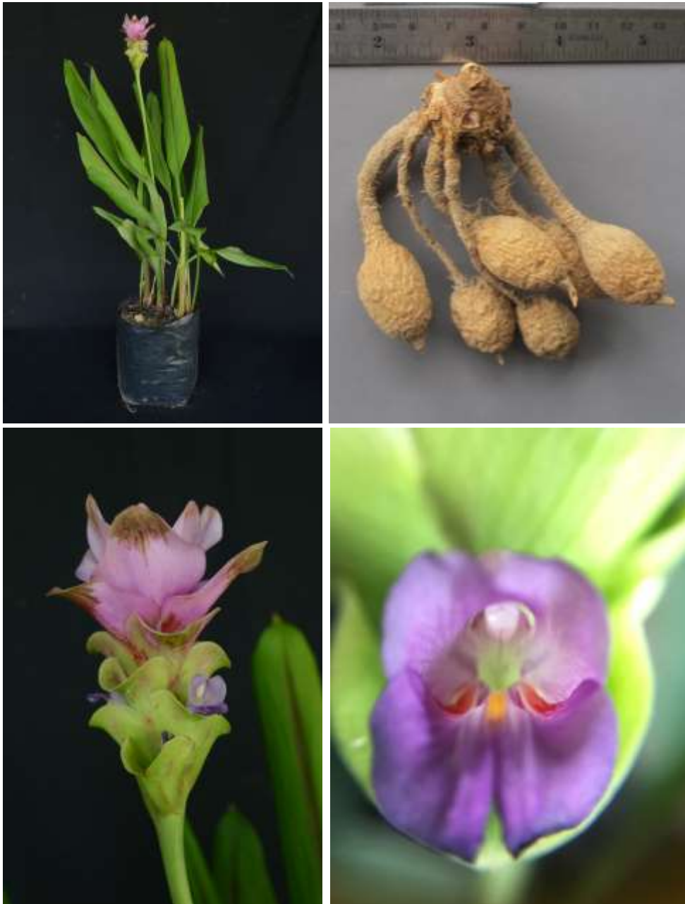
ปทุมมาพันธุ์เซียงรายซีเอฟ 33