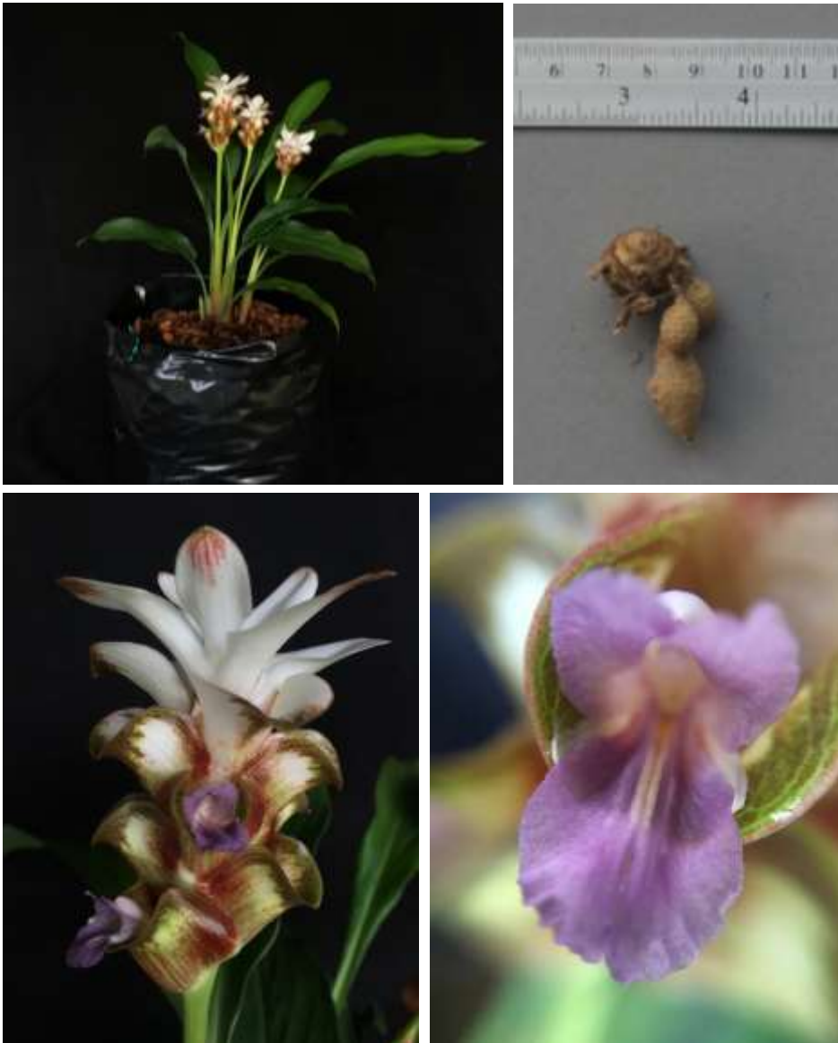
ปทุมมาพันธุ์เชียงใหม่ 38