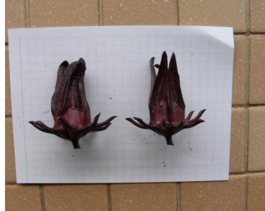
กระเจียบแดงพันธุ์กำแพงแสน เอชเอ กลีบหุบ