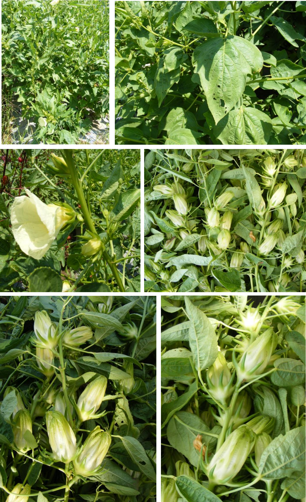
กระเจี๊ยบแดงพันธุ์กำแพงแสนขาวจัมโบ้