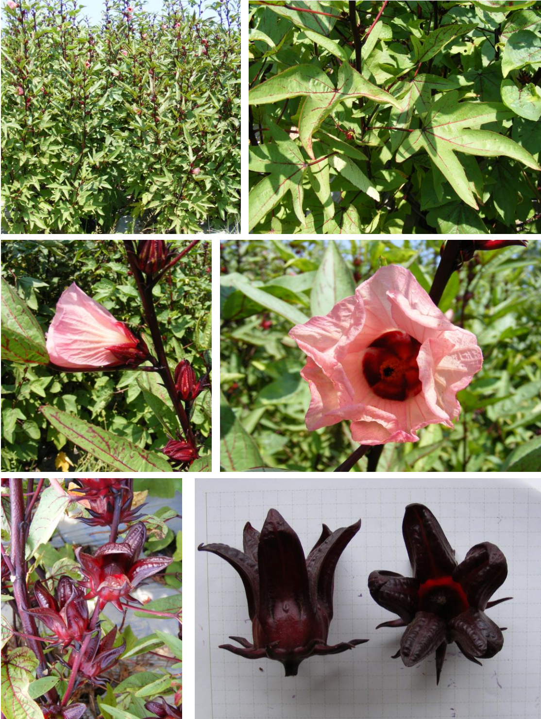
กระเจี๊ยบแดงพันธุ์กำแพงแสน เอชเอ กสิ์บบาน