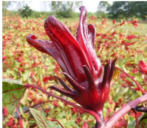
กระเจียบแดงพันธุ์กำแพงแสนม่วงจัมโบ้