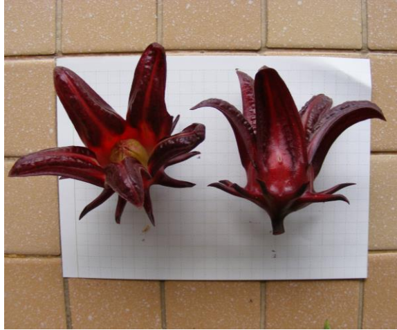
กระเจี๊ยบแดงพันธุ์กำแพงแสนม่วงจัมโบ้กลีบบาน