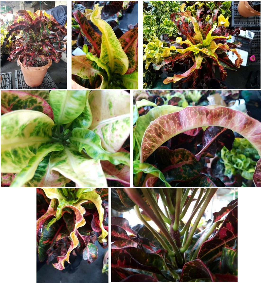
โกสนพันธุ์ท่าเสด็จ

หมายเหตุ : เทียบสีด้วย The 5th Edition Royal Horticultural Society Color Chart 2012 (RHSCC)