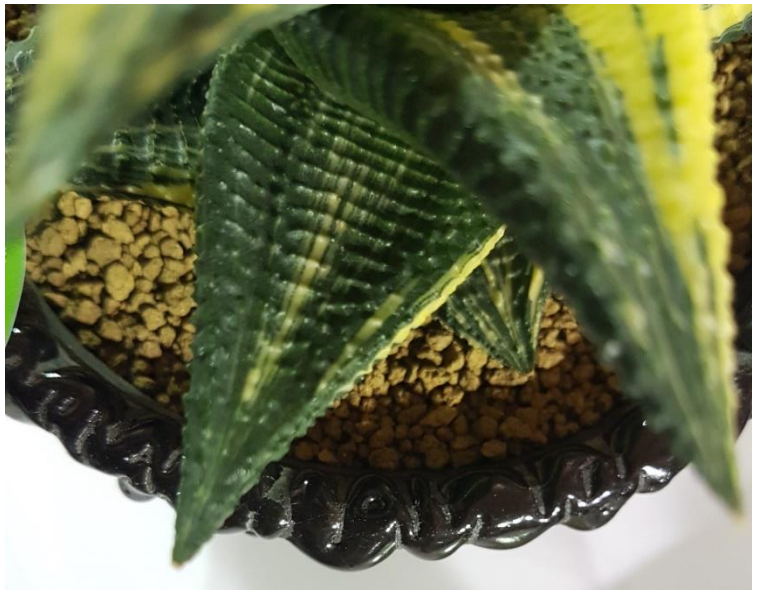
ม้าเวียนลูกผสมพันธุ์ชิโนบุ (Shinobu)