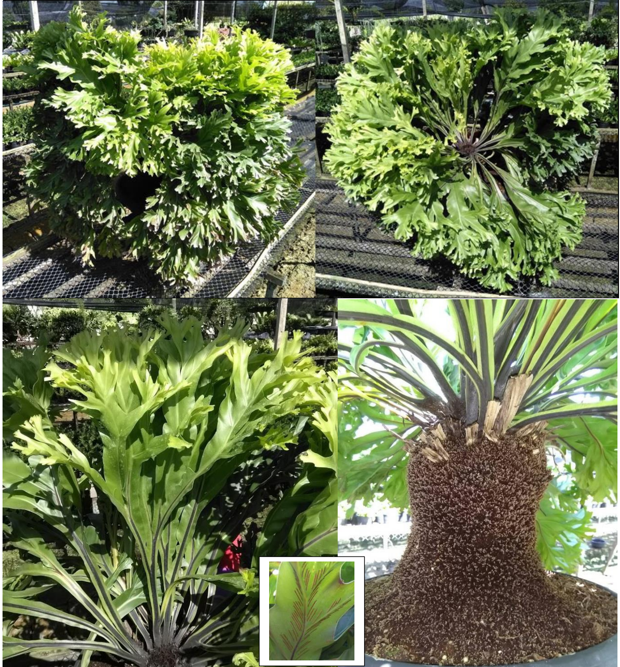
ข้าหลวง (กลุ่มราชา) พันธุ์พิทักษ์

หมายเหตุ : เทียบสีด้วย The Royal Horticultural Society Color Chart (RHSCC) 1995 edition