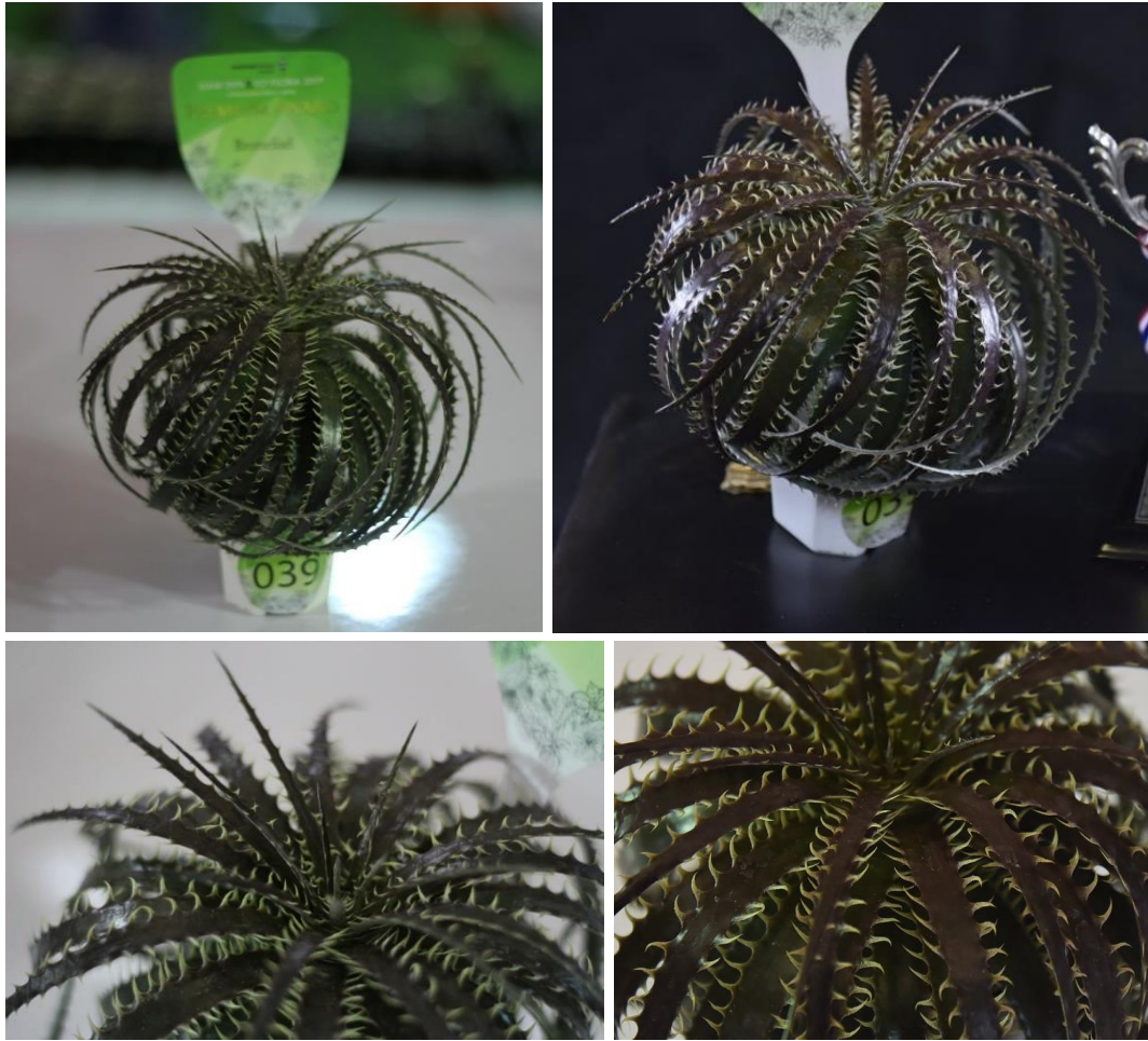
สับปะรดหนามลูกผสมพันธุ์สีบดครับ