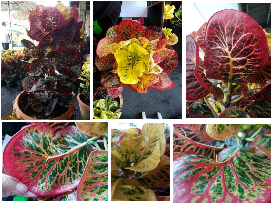
โกสนพันธุ์บางกอก

หมายเหตุ : เทียบสีด้วย The 5th Edition Royal Horticultural Society Color Chart 2012 (RHSCC)