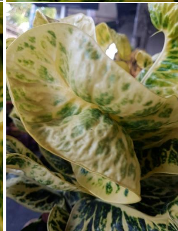
โกสนพันธุ์ทองหล่อ