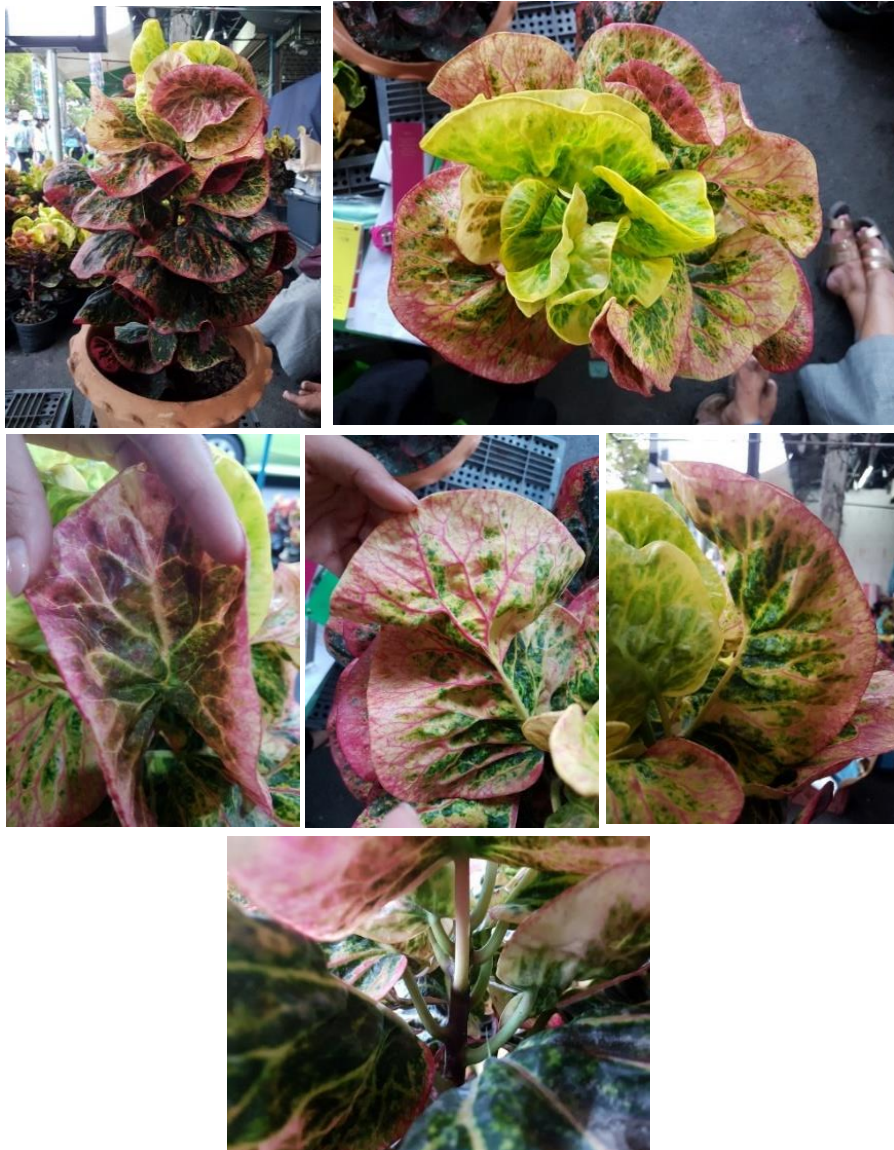
โกสนพันธุ์นครพิงค์

หมายเหตุ : เทียบสีด้วย The 5th Edition Royal Horticultural Society Color Chart 2012 (RHSCC)