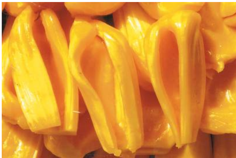
ขุ่น พันธุ์หอมทอง