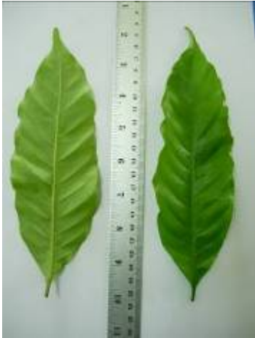
ลักษณะกิ่ง ใบ และช่อของกาแฟโรบัสต้าสายต้น FRT09