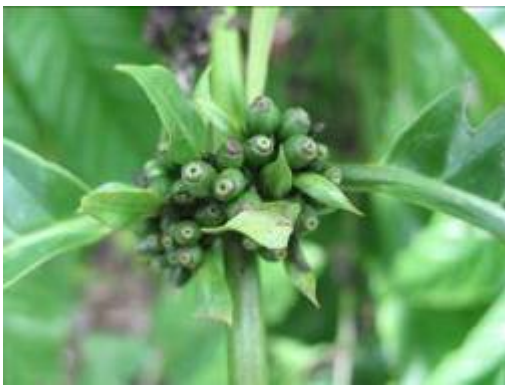
ลักษณะการติดผลและช่อผลของกาแฟโรบัสต้าสายต้น FRT09