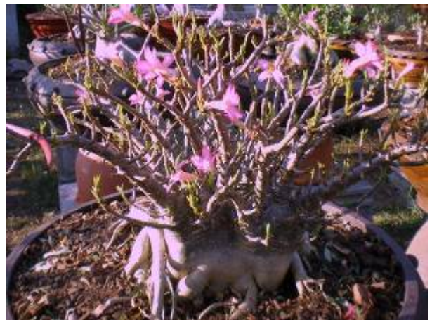
ลักษณะทรงต้น