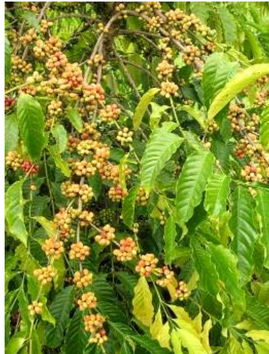
ลักษณะการติดผลและข้อผลของกาแฟโรบัสต้าสายต้น FRT68