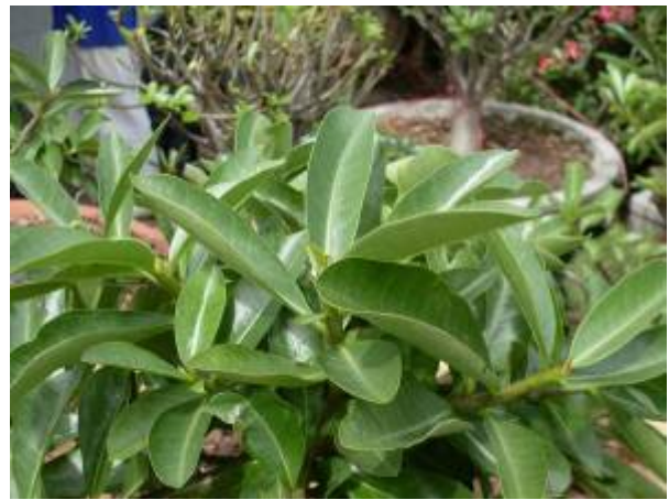
ลักษณะใบ