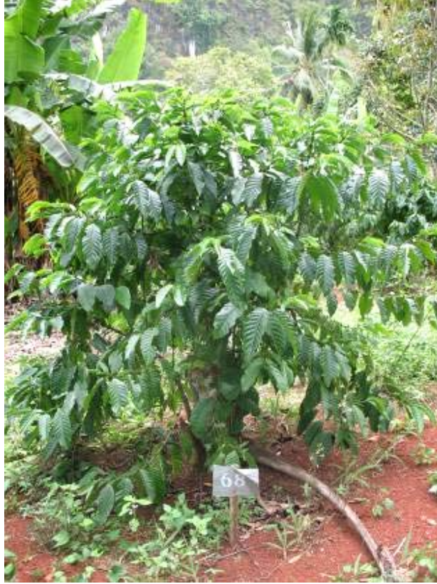
ลักษณะทรงพุ่มของกาแฟโรบัสต้าสายต้น FRT68