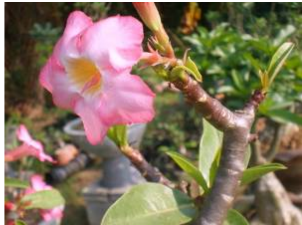
ลักษณะดอก