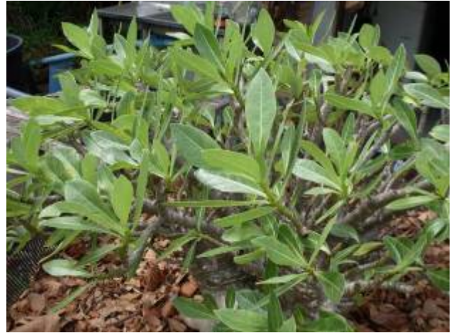
ลักษณะใบ