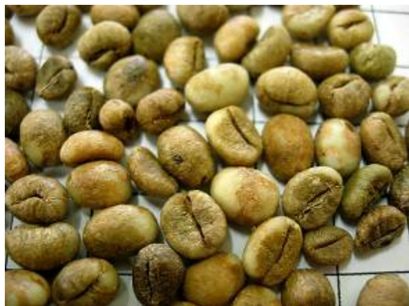
ลักษณะเมล็ดกาแฟแห้งของกาแฟโรบัสต้าสายต้น FRT09