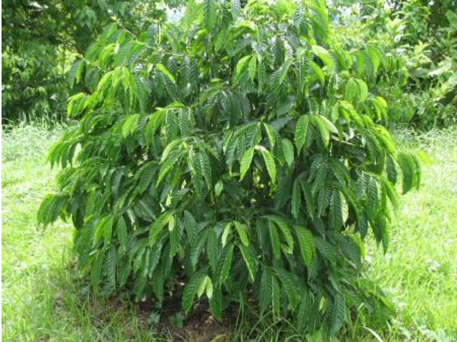
ลักษณะทรงพุ่มของกาแฟโรบัสต้าสายต้น FRT09