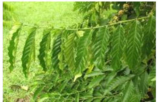
ลักษณะกิ่ง ใบ และข้อของกาแฟโรบัสต้าสายต้น FRT68