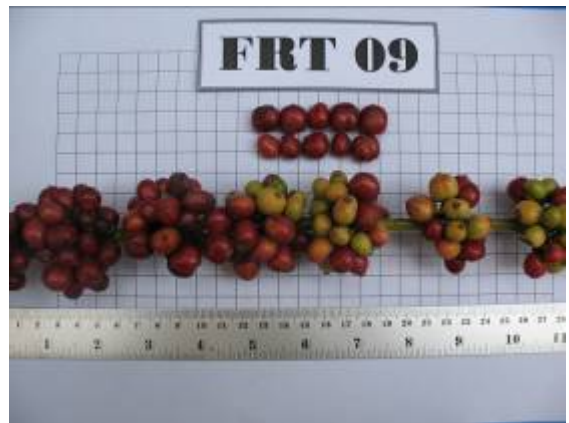
ลักษณะช่อผลและผลของกาแฟโรบัสต้าสายต้น FRT09