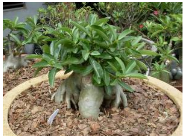
ลักษณะทรงต้น