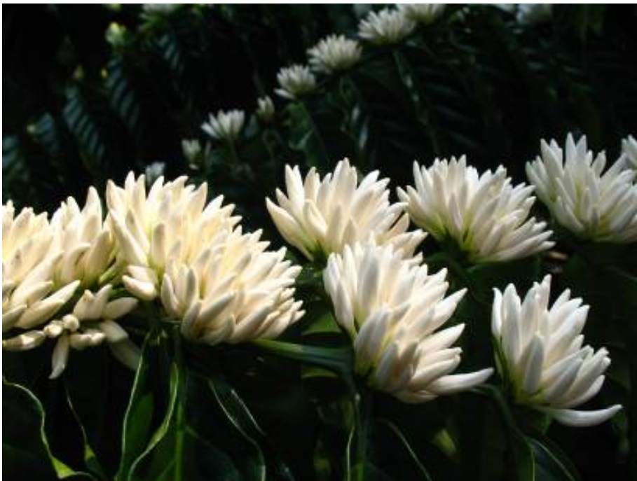
ลักษณะช่อดอกของกาแฟโรบัสต้าสายต้น FRT09