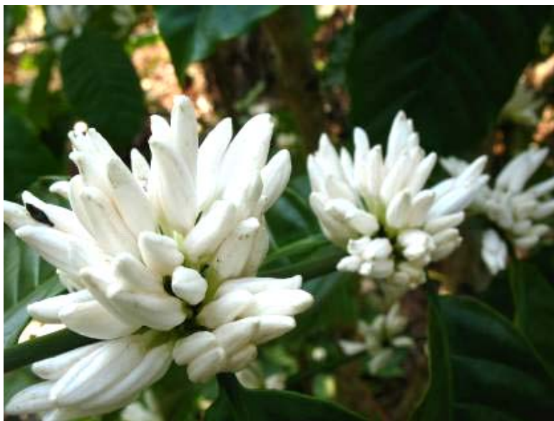
ลักษณะช่อดอกของกาแฟโรบัสต้าสายต้น FRT68