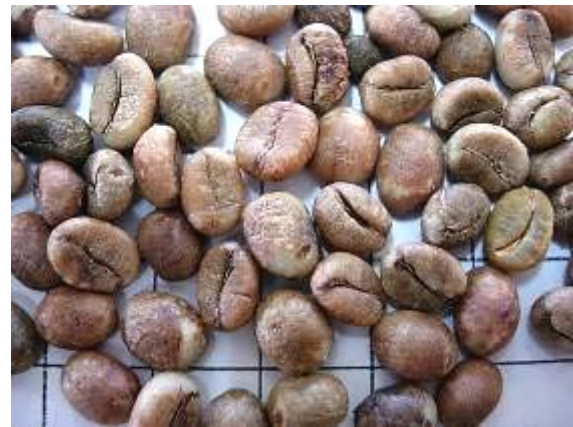
ลักษณะเมล็ดกาแฟแห้งของกาแฟโรบัสต้าสายต้น FRT68