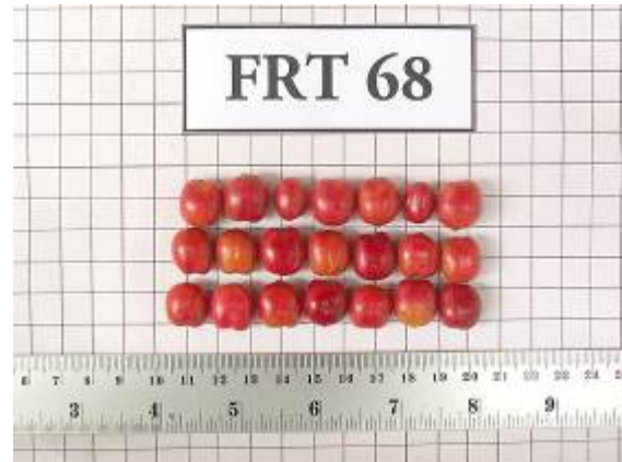
ลักษณะช่อผลและผลของกาแฟโรบัสต้าสายต้น FRT68