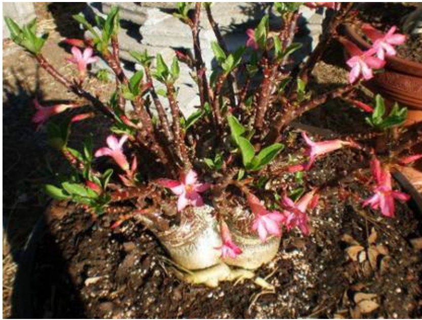
ลักษณะดอก