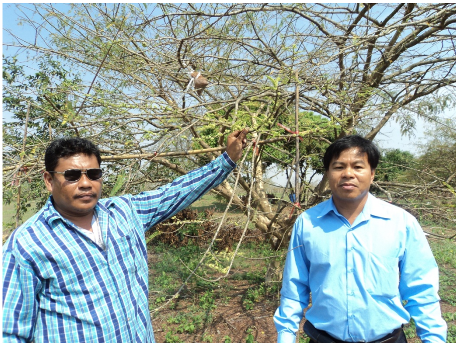
ต้นพ่อแม่พันธุ์ อายุ 24 ปี