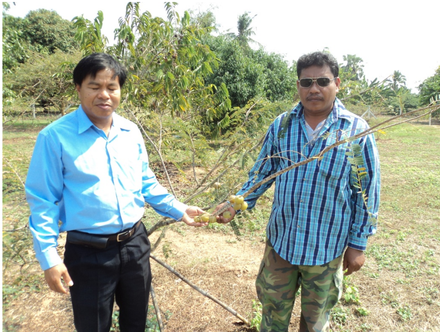
กิ่งทาบให้ผลผลิตเมื่ออายุ 1 ปี