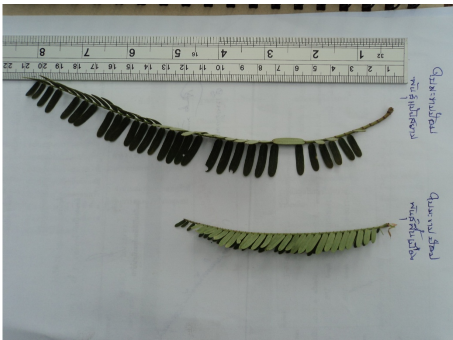
ก้านใบยาว 20 - 40 เซนติเมตร (ในฤดูฝน)