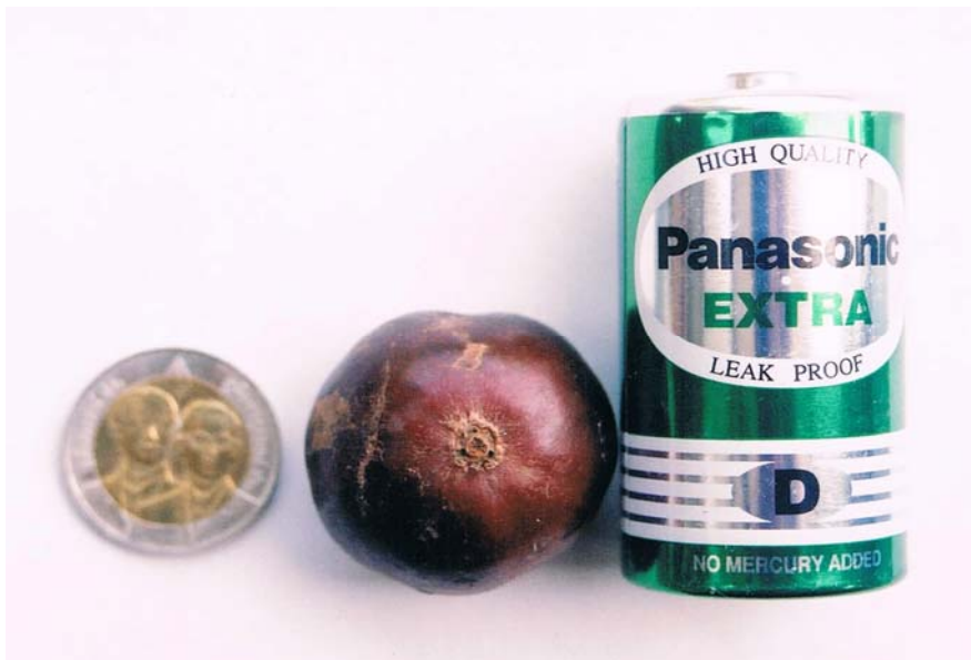
ตะขบพันธุ์ตะขบยักษ์สมใจ