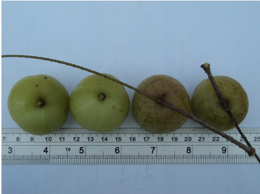
ผลมีขนาดเส้นผ่านศูนย์กลาง 3 - 4 เซนติเมตร