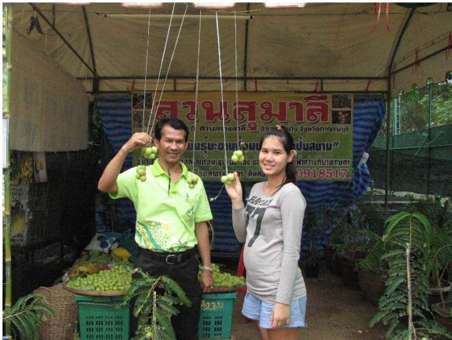
ร่วมออกร้านตลาดเกษตรสีเขียว เทิดไถ้องค์ราชันย์