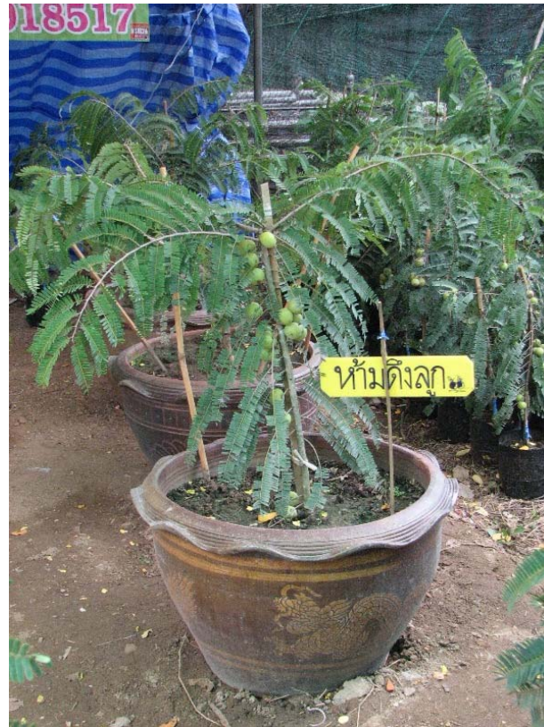
กิ่งทาบอายุ 2 เดือน