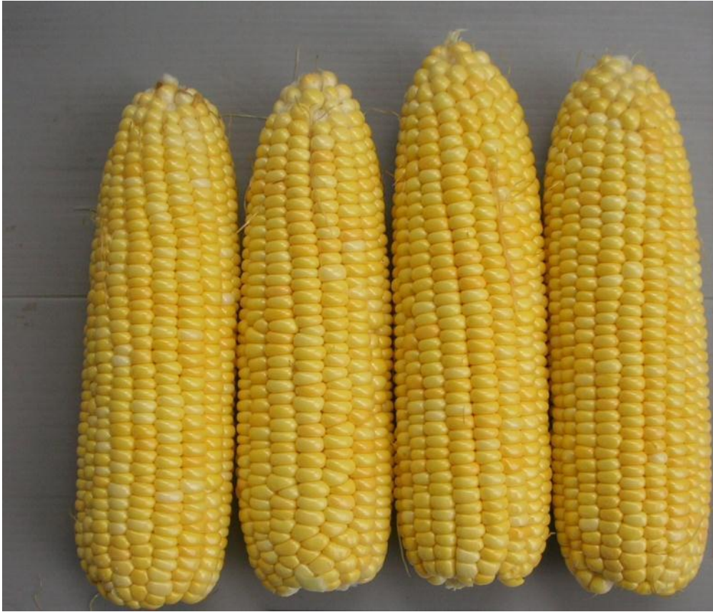
ภาพฝักสดปอกเปลือกของข้าวโพดหวานพันธุ์ชัยนาท 1 (CNSH 7550)