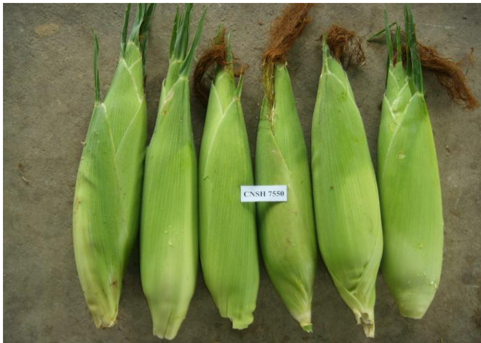
ภาพฝักทั้งเปลือกของข้าวโพดหวานพันธุ์ชัยนาท 1 (CNSH 7550)