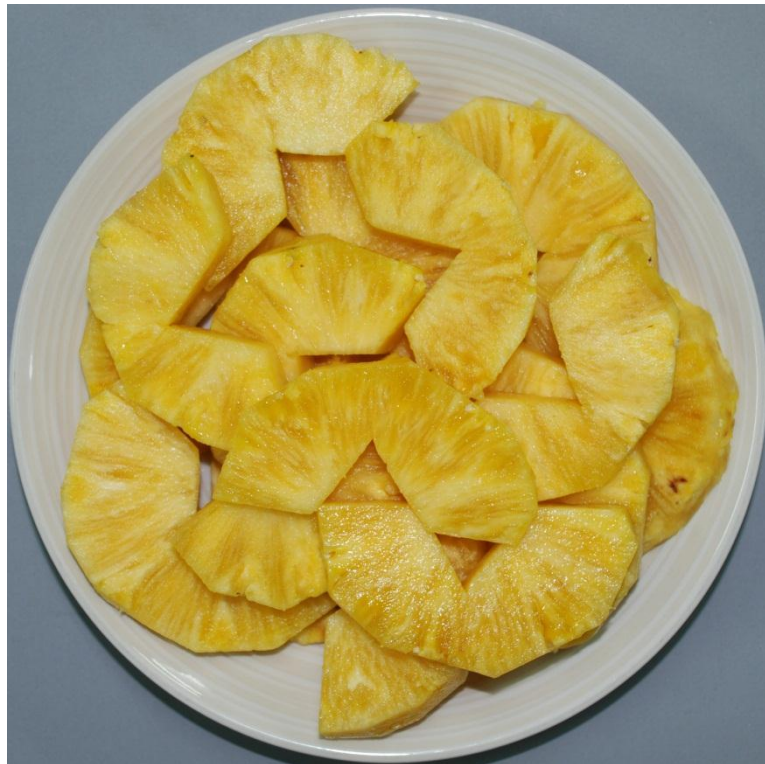
สับประรดพันธุ์เหลืองสามร้อยยอด