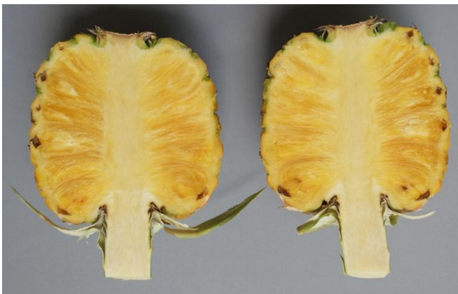
พันธุ์เหลืองสามร้อยยอด