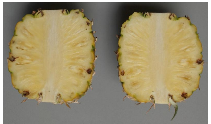
พันธุ์ปัตตาเวีย

เปรียบเทียบลักษณะพันธุ์เหลืองสามร้อยยอดและพันธุ์ปัตตาเวีย