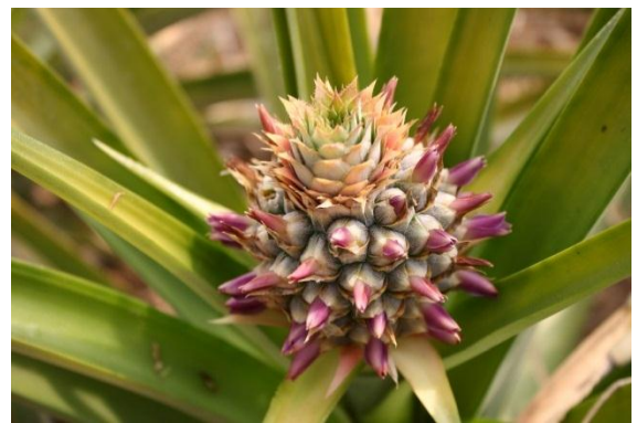
สับปะรดพันธุ์เหลืองสามร้อยยอด