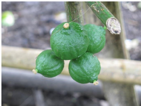
มะนาวบ้านพะโท