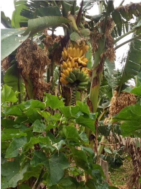
กล้วยป่า