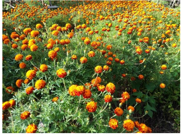
ดาวเรือง