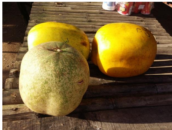
ฟักพื้นบ้าน