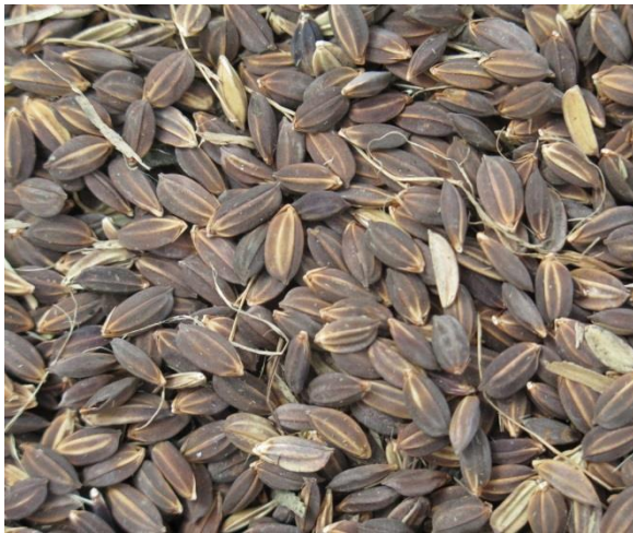
ข้าวพันธุ์ป้อชูแบะ

ได้แก่ ข้าวพันธุ์พื้นเมือง กระเจียบขาว กระเจียบแดง ขมื่นชั้น ชิงพื้นบ้าน และไหลดำ เป็นต้น