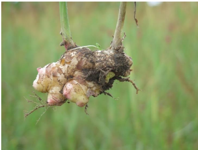
ขิงพื้นบ้าน