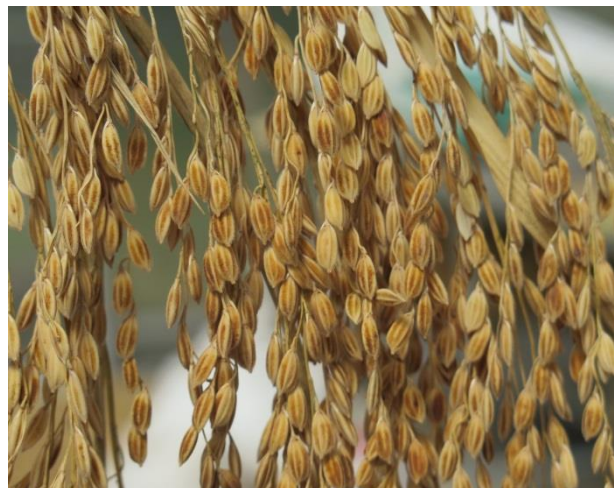
ข้าวพันธุ์ป้อกี