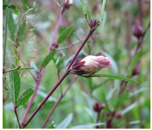
กระเจียบแดง