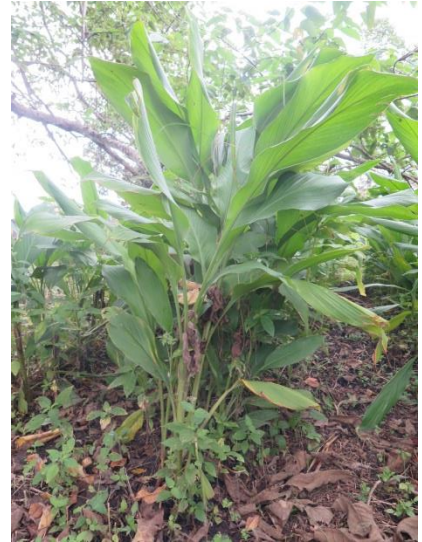
ขมิ้นชัน