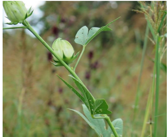
กระเจียบขาว